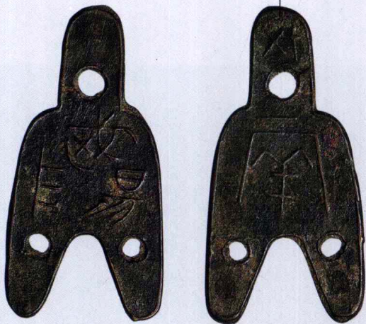
IO 战国 赵 大型“武阳”背“一两”三孔布

通长 76mm，宽 38mm，重 15.5g，有极小微修，存世孤品，极美品，此品位列古泉五十名珍，此为国内首次拍卖