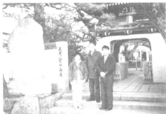
日本滋贺大学教育学部长指导 首次考察近江八景之“坚田落雁”（2003年冬）