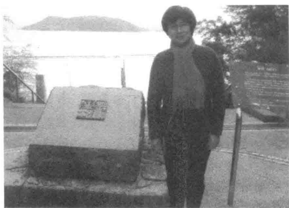
“志贺独钓”，博多八景之一。志贺岛是建武中元二年（57） 东汉光武帝印绶“汉倭奴国王”金印出土地。