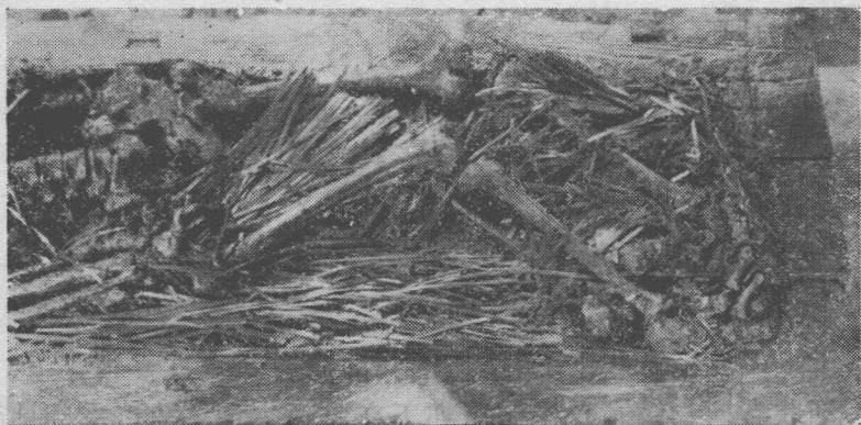
图二 睡虎地十一号墓棺内竹简出土情况（棺下部）

保存较好，字迹清晰，只有少数残断。这批秦简经科学保护，细心整理拼复后，总计有简一千一百五十五支（另残片八十片），内容计有下列十种：