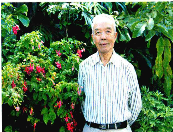
2016 年陈晶教授在奥克兰