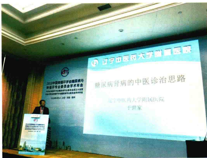
于世家教授在全国学术会议上做讲座