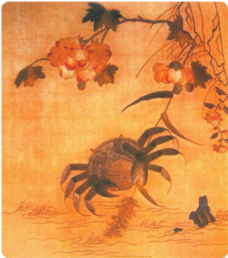
图 1-4 宋代刺绣黄荃画芙蓉螃蟹图(台北“故宫”博物院藏)

社会发展的最高阶段，其物质文明和精神文明所达到的高度，在中国整个封建社会历史时期之内，可以说是空前绝后的。”宋代是绣画艺术的开创时期，也是手工刺绣发展的高峰时期。由于宋代绘画、书法等相关艺术文化的高度发展，宋代刺绣工艺突破性地开创了对名家的画作进行刺绣临摹，俗称绣画。这种纯欣赏类的刺绣传承了独有的宋代书画风情，宋代绣画受院体画影响，山水、楼阁、花鸟、人物等绣画构图简练、形象生动、设色精妙。这种将绘画与刺绣工艺相结合的表现形式，主要通过画师供稿、艺人绣制的方式呈现，形成了画绣结合的纯审美艺术风格（图 1-4）。