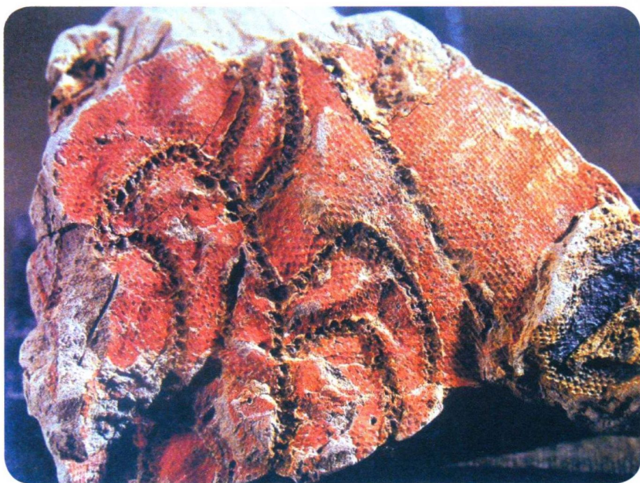
图1-1 刺绣印痕文物（陕西宝鸡市茹家庄西周鱼伯墓）

通过现有的传世文献和考古资料推断可知，现今可见的刺绣遗迹最早出现在夏商周时期。1974年，在中国陕西宝鸡市茹家庄西周鱼伯墓中，挖掘出来留存至今的刺绣印痕，这是迄今为止我国发现最早有关刺绣工艺的考证（图1-1）。《管子》曰：“昔者桀之时，女乐三万人，端噪晨，乐闻于三衢，是无不服文绣衣裳者。”由此说明西周时期贵族服饰已开始使用刺绣进行装饰制作并为皇族、贵族阶层所专用。从出土的各类刺绣残存实物的考察中可以发现，无论是商代附粘在铜觶（一种古代饮酒器）上的菱纹绣还是殷墟出土的玉石人像上的服饰花纹都显示当时刺绣装饰的盛行。