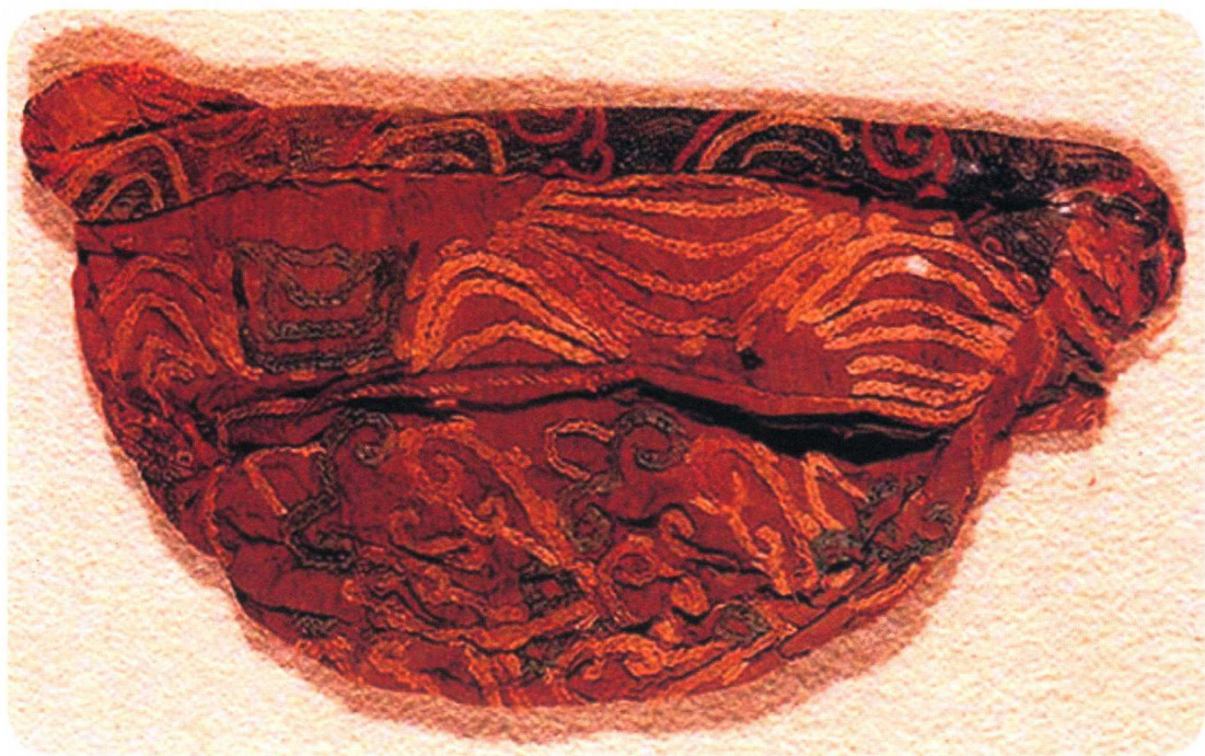
图 1-2 汉代刺绣残片

在丝织产业发展的大背景下，随着社会等级制度的强化和古人审美水平的提高和发展，刺绣工艺也在渐趋成熟。刺绣工艺发展至汉代已经在无形中开始区分使用刺绣的人群等级和种类，形成了宫廷刺绣。东汉王充在《论衡·程材篇》中描述：“齐郡世刺绣，恒女无不能；襄邑俗织锦，钝妇无不巧。日见之，日为之，手狎也。”由此说明当时的汉王室在齐郡的临淄（今山东临淄）设下了专门制作官服的机构，用于满足皇室和统治阶级在服饰刺绣上的需要，足以反应出当时刺绣技艺和生产的普及（图 1-2）。