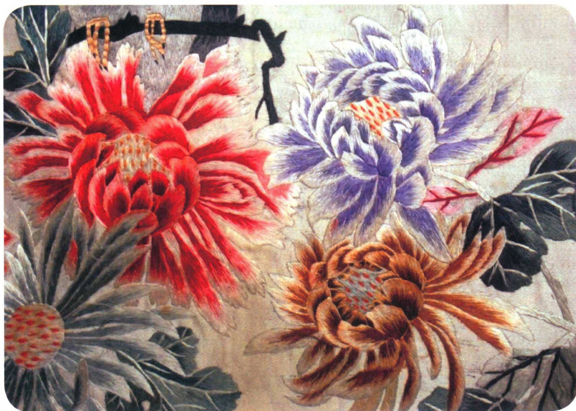
图 1-8 苏绣