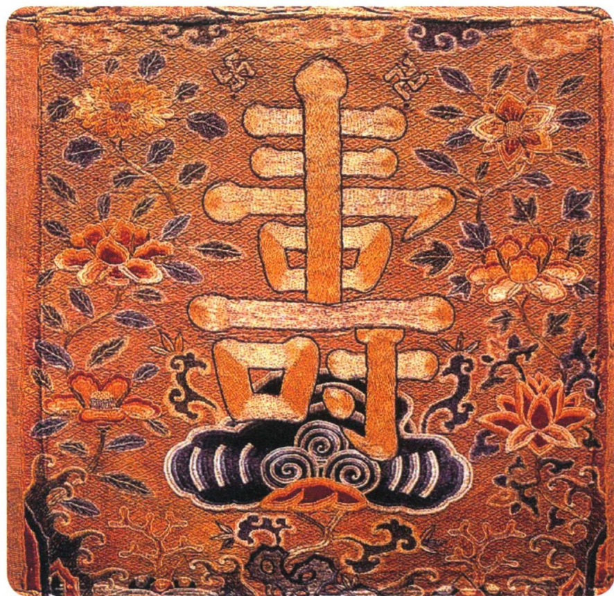
图 1-6 明代吉服纹样

直至明末清初，西方文化涌入中国，全国出现了众多生产具有商品属性绣品的刺绣作坊。商品市场促进了民间手工业的发展，从缺乏竞争力的官府院落手工艺品，到商业性作坊的专业化生产，加上唐宋期间文人手艺人的结合，使刺绣技术和生产获得了前所未有的发展，达到了中国传统刺绣的巅峰时期（图 1-7）。