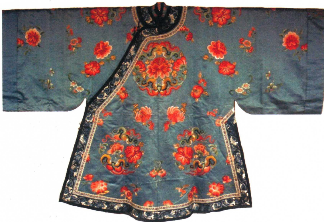
图 1-7 清代吉服刺绣纹样