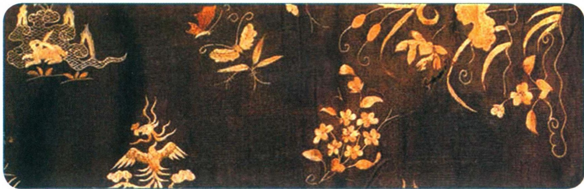
图 1-5 元代棕色罗刺绣 花鸟纹夹衫局部

代刺绣基础上又增加了“贴绫绣”，这是元代常用的刺绣针法，就是在刺绣图案上加贴绸缎并修剪成型，在此形状上进行缀绣，这也是后来“塑绣”的基础（图 1-5）。