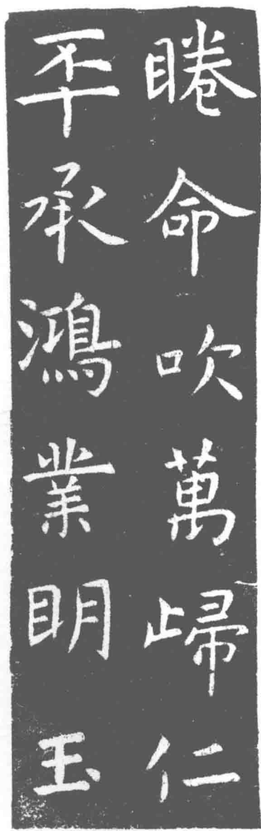
虞世南《夫子庙堂碑》