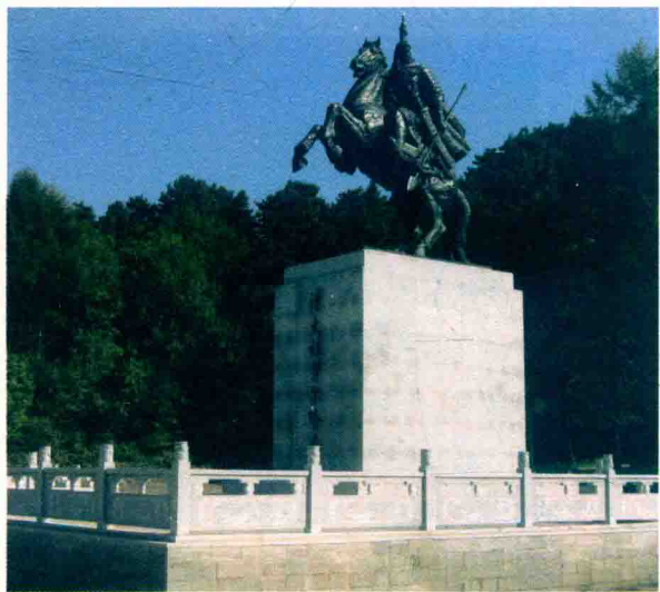
萨尔浒风景区努尔哈赤铜像

此时，四贝勒皇太极带领的后金先头部队赶到，两面夹击明军，明军大乱。当天下午，努尔哈赤的大军赶到，立刻冲击明军的营垒。明军只这一路人马，在人数上并不占优势，再加上地形不熟，远道疲惫，渐渐抵挡不住，结果杜松这一路人马全军覆没，杜松死难。