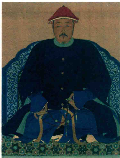
清太宗皇太极便服像·清

时期，特别是后金军占领辽河平原以后，后金大量移民，强占汉人田地。努尔哈赤把被俘的汉人分配给女真人做奴隶。种田的汉人，每13个劳力被编为1“庄”，给女真人当财产。在这种剥削制度下，辽东汉民或逃亡，或反抗，女真人也付出了很大代价。一时间，后金国内丁壮锐减，田园荒芜，民不聊生。皇太极即位后发布命令，规定汉人的“庄”直接属于金国的汗，由汗选派汉官来统治。同时还规定，汉人与女真人同样纳税，犯法与女真人同罪。