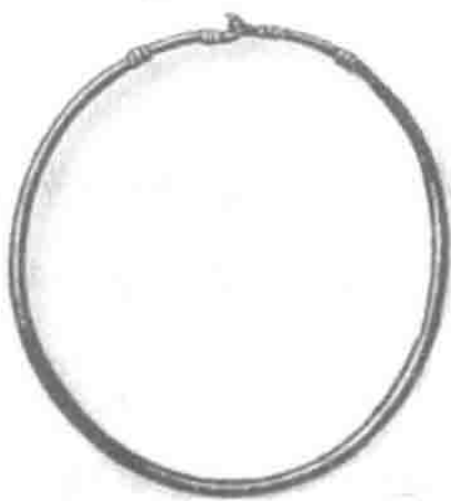
在库尔斯克州发现的 11 ~ 12 世纪的斯拉夫格里夫纳

当地人之间主要进行的是被称为“库纳”的貂皮和松鼠皮的买卖。后来就开始把银币称为库纳。为进行计算,除了作为重量单位的格里夫纳,还采用了另外一种格里夫纳,这种格里夫纳被称为“库纳格里夫纳”,是指一定数量银币的计量单位。