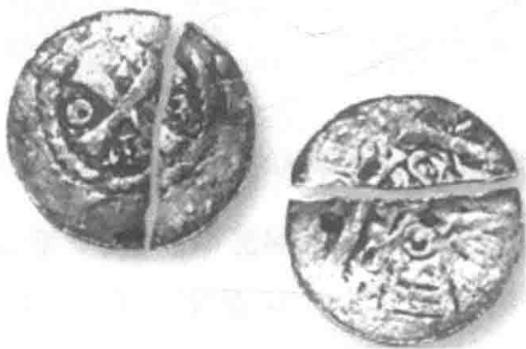
10 ~ 11 世纪的由欧洲银币狄纳里切割而成的列扎纳

1 库纳是重约 2 克的银币。必要时,银币被切分成两部分,于是银币就变成了“列扎纳”,大约等于 1/2 库纳。1 库纳格里夫纳为 50 列扎纳。