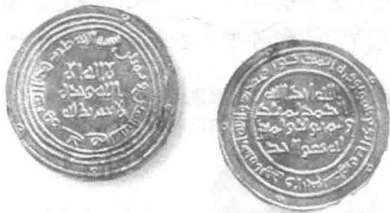
公元685~705年流通的阿拉伯的银币迪拉姆

在这一时期,位于森林和草原交界地带的一座不大的城邦成为南北贸易的重要中转站,意义日益凸显。可萨人称其为“萨姆巴特”,当地居民则称之为“基辅”。诺曼商人在这里“改装”自己的大帆船,将河用浆换成海用浆,并准备克服最后一段最困难的航程——在这段航程上不仅石滩密布,沿河两岸还有可萨人的骑兵出没。