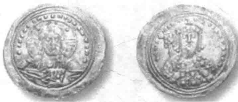
瓦西里二世和康斯坦丁八世在位期间 (976 ~ 1028 年)的拜占庭金币索利多