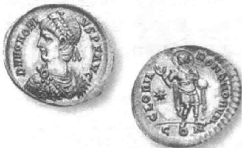
霍诺留皇帝在位期间(395 ~ 423 年)的拜占庭银币米拉伦斯