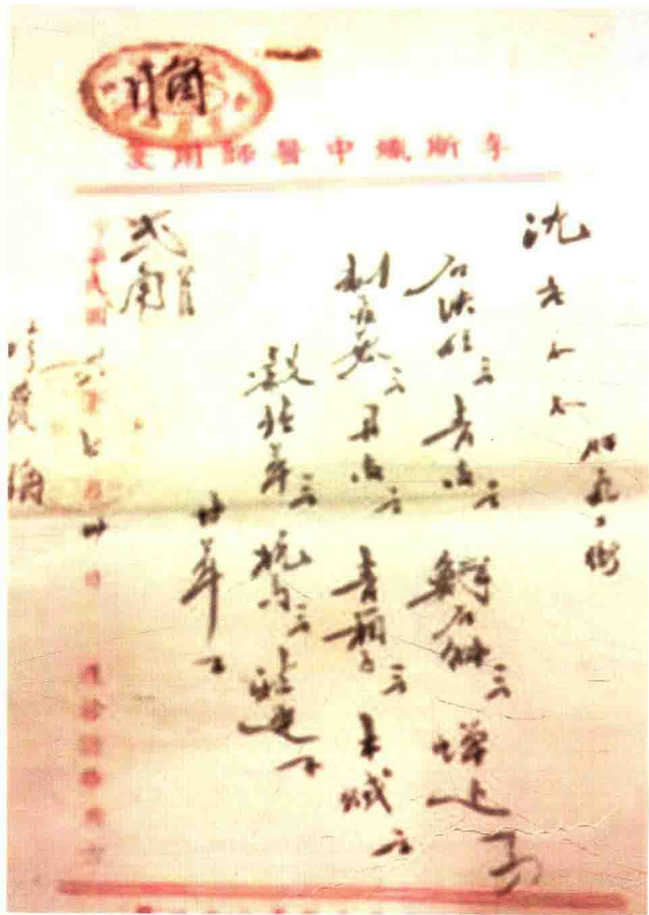
李斯炽1949年亲笔处方