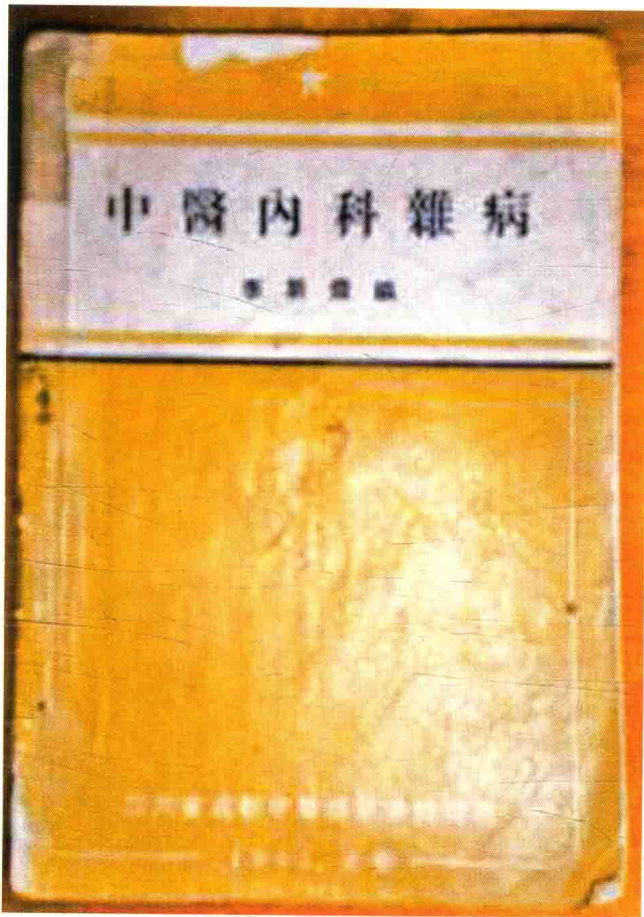
《中医内科杂病》书影