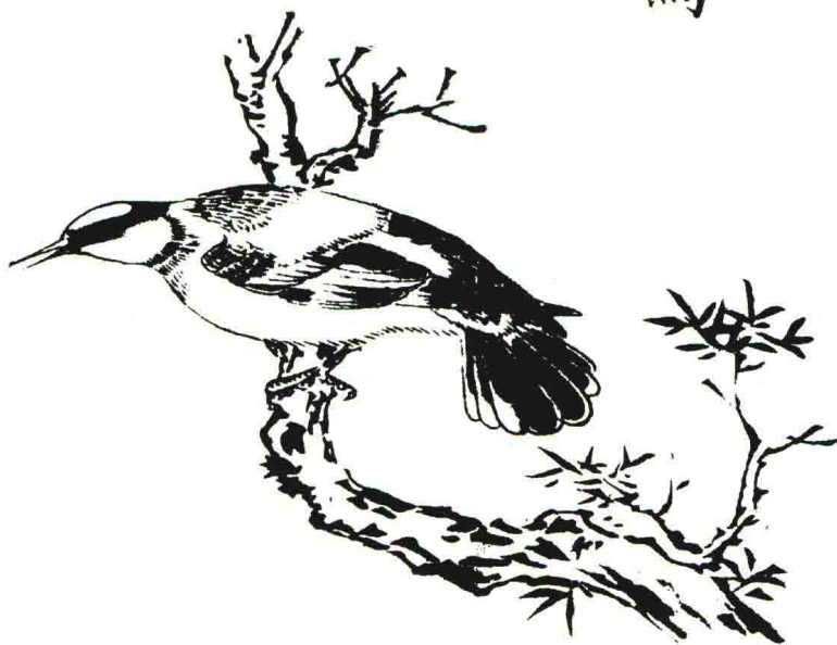
《毛诗品物图考》黄鸟