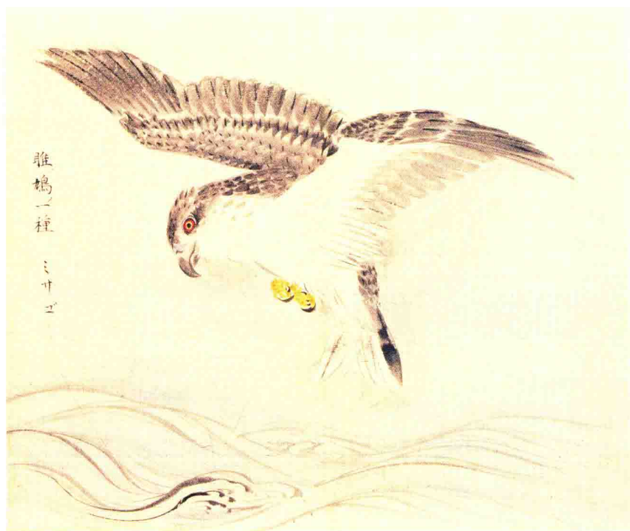
《诗经名物图解》睢鳩