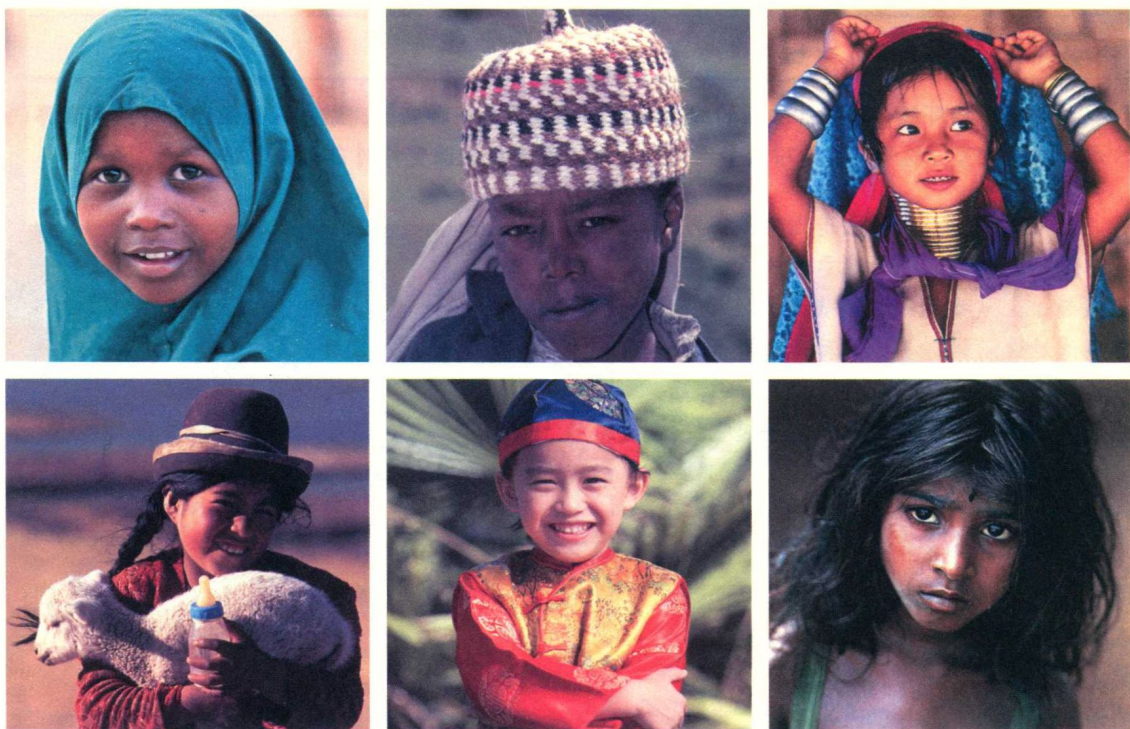
◎ 照片中的儿童分别来自肯尼亚、埃塞俄比亚、缅甸、秘鲁、韩国和印度。如果出生在上述任何一个国家，那么我们的生活会有什么变化？不难发现，社会对个人是有所影响的。

有钱人与穷人)，社会形塑他们生活的方式是完全不同的。我们所属的社会类别决定了我们独特的生活经历。当我们意识到这一点的时候，也就开始利用社会学的视野来观察世界了。