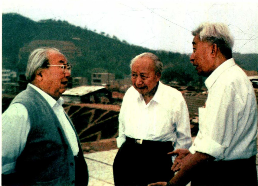
1996年5月，费孝通（左）参加京九铁路沿线地区实地考察。停车休息时与丁石孙（右）、钱伟长等交谈