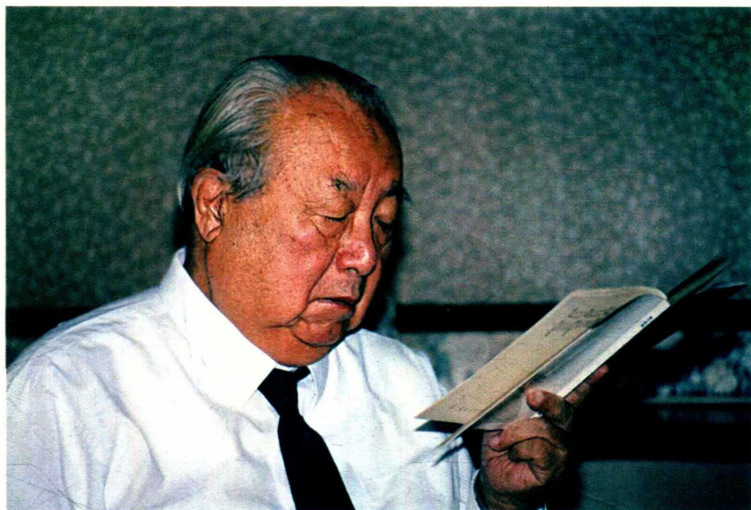
1993年6月，费孝通考察山东乡镇企业，在途中休息的宾馆中读书