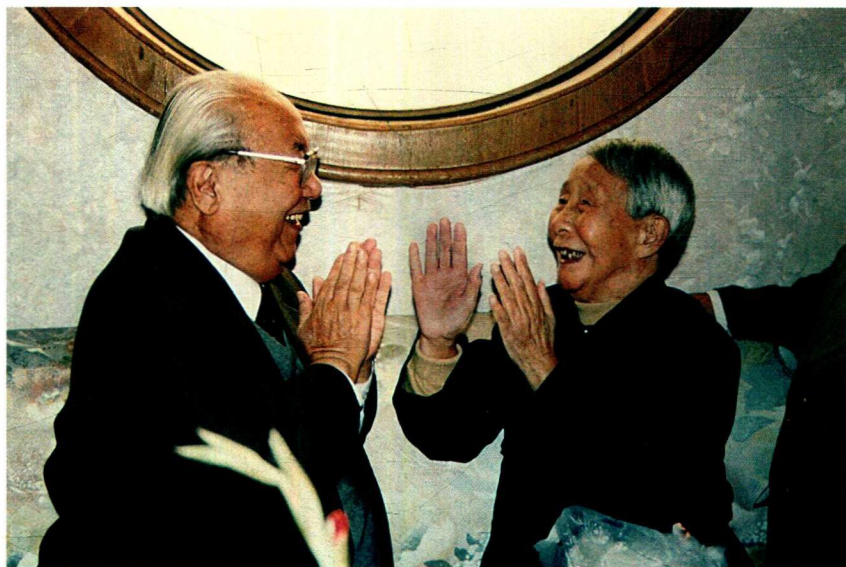
1997年10月，费孝通（左）回到家乡江苏吴江同里镇看望姐姐费达生。姐弟俩玩小时候的拍手游戏