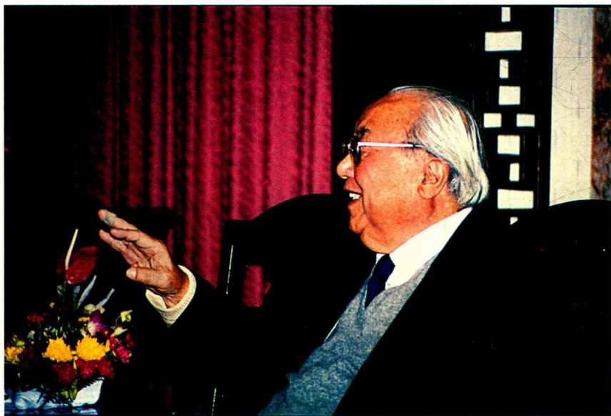
1995年11月，费孝通在江苏张家港馨苑宾馆谈长江全流域发展