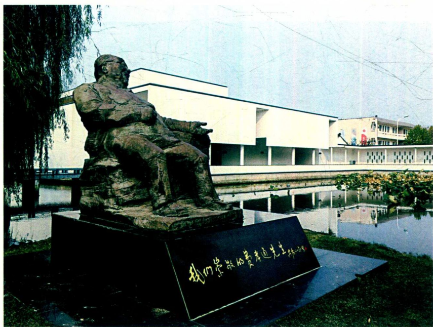
费孝通江村纪念馆中的费先生塑像。背景是该馆主体建筑