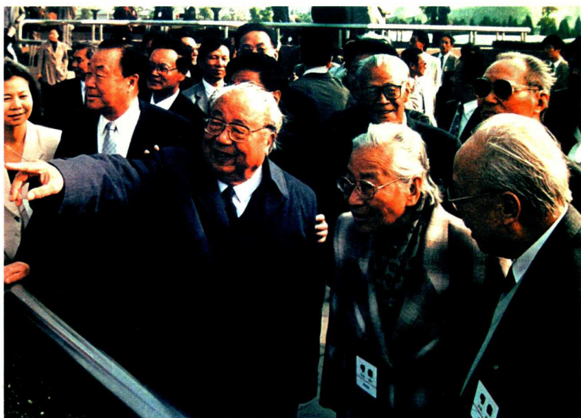
1995年11月，费孝通（前右三）参加苏南、浦东实地考察途中，在上海东方明珠塔下和雷洁琼、钱伟长等交谈