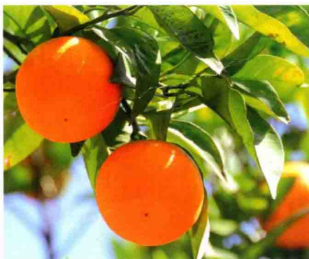
柑橘类果实精油通过浓缩果皮制得。

岩蔷薇精油从岩蔷薇的叶和茎中制得。在一些植物中，精油是从花瓣中制得的，这是一个微妙的过程。