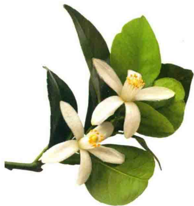
苦橙花精油，提取苦橙鲜嫩花朵，具有强烈的花香。

数千年以来，芳香精油一直被用于传统的康复医疗，帮助人们恢复健康、提升幸福感。精油芬芳的气味可以影响人们的情绪和所处的氛围，具有不同文化背景的人们也会将相应的芳香植物用于精神仪式和个人生活。在许多地区，人们的生活一直离不开精油，如今芳香理疗已成为自然养生的一个重要组成部分。