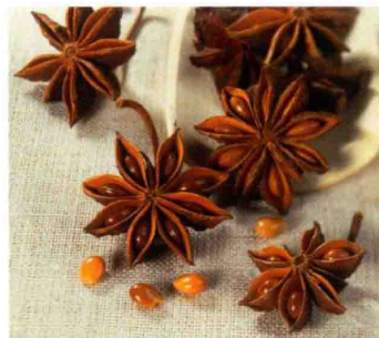
无论是干籽还是新鲜的种子均可通过压榨制取精油。