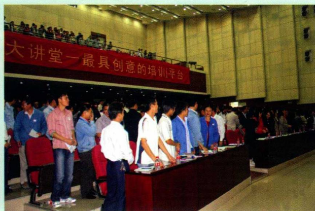
800 多人济济一堂：同一老师、同一地区，连续 6 个主题的大型演讲！行业罕见，顺德奇迹