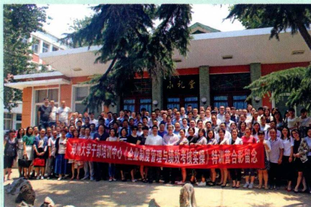
河南企业家真心爱学习，三四十人的总裁博士班引出一个 150 多人的特训营——2016 年于郑州