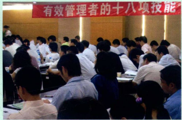
深圳的经理人学习“有效管理十八项技能”一点也不含糊，各类机构在深圳开设公开课10次以上