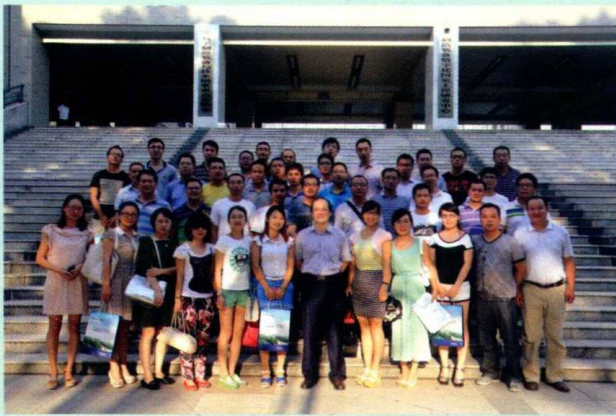
华中科技大学，葛洲坝集团“有效管理十八项技能”课后合影