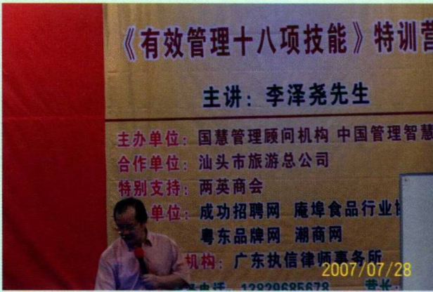
“有效管理十八项技能”特训营接受了时间的检验