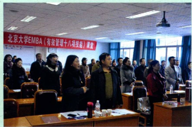
热爱学习、尊重知识——总裁班“有效管理十八项技能”授课现场，学员起立