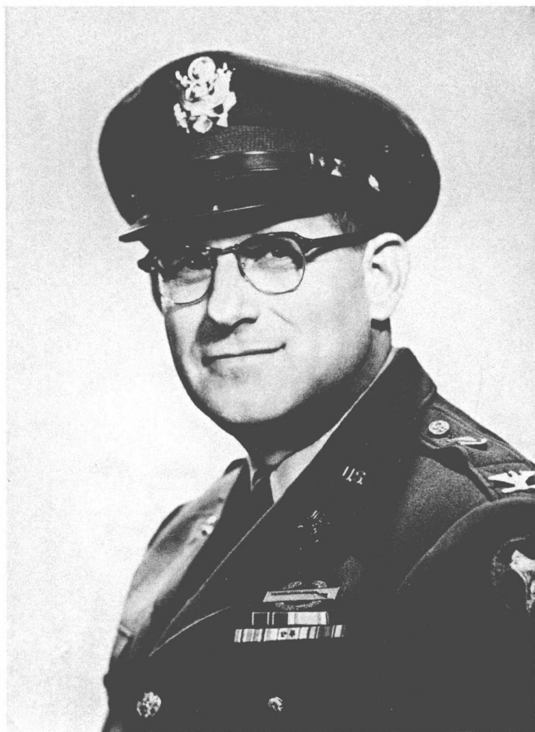
彼得金上校（1904—1992年，摄于1953年）