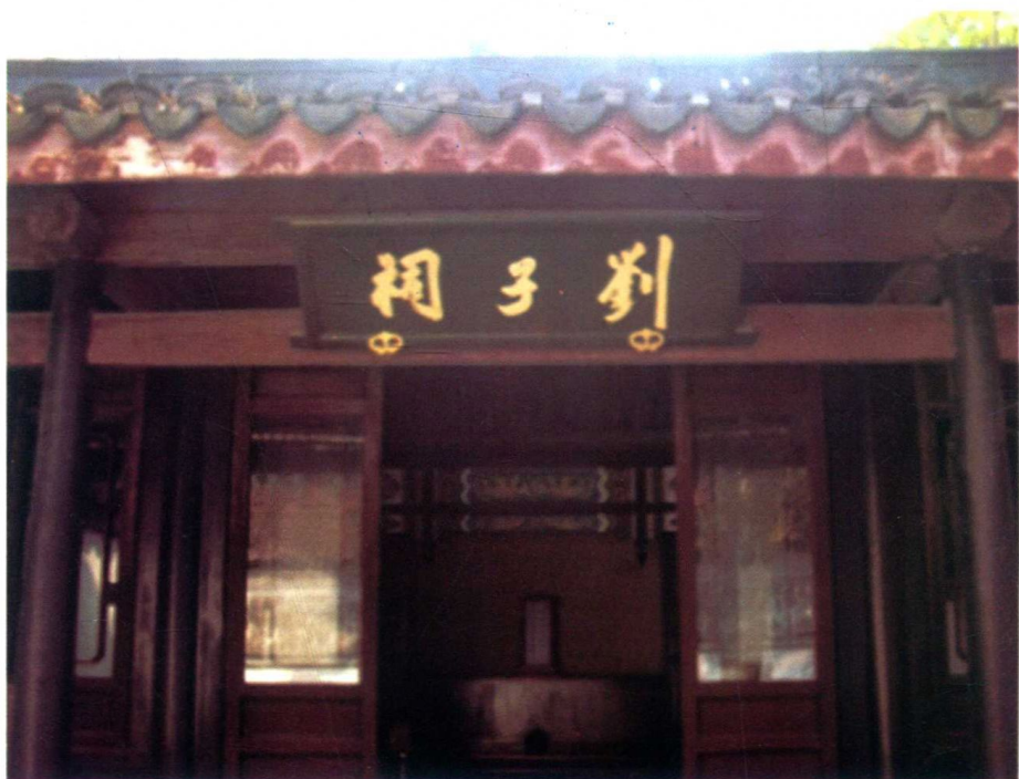
绍兴蕺山书院刘子祠