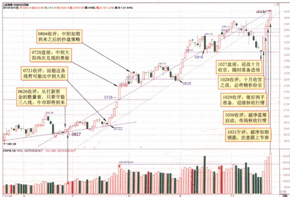
图 X-2 上证 2014-10-31 留影

例如,他在2014年6月27日至10月31日期间发布的盘前预报值,竟然连续85个交易日精准对应大盘实际走势(详见图X-2)。