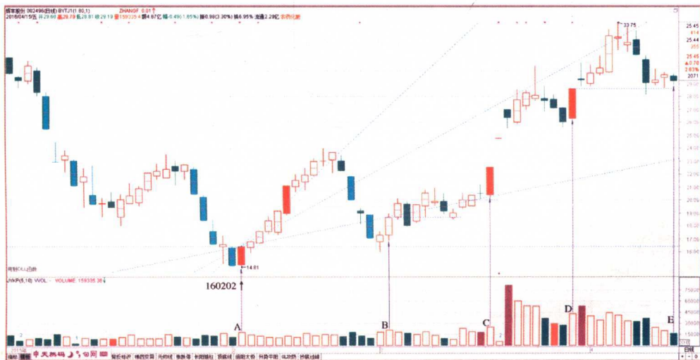
图 X-3 002496 辉丰股份

简言之,“黄金柱”是市场主力“谋攻”的战术组合。黄金柱的基柱反映的是主力做多的意愿,因此它应该是一根有一定幅度的带量阳线。如果是跳空高开的阳线那就更显示出主力强烈的做多意愿。黄金柱后3天的“价涨量缩”则是主力对市场跟风做多意愿的评估。理想状态是量柱有规律的递缩,价柱有规律的递增。如是,主力则会毫不犹豫地继续拉升。如此看来,评价一个黄金柱建构的质量有两个要点:一看基柱,评估主力做多意愿的强弱;二看“价涨量缩”,评估市场做多氛围的强弱。大多数人其实没有真正意识到黄金柱的重要性!黄金柱既然是主力“谋攻”的行为,那么它只会出现在上升趋势之中。这就解决了趋势研判核心的核心即“方向”问题。那你说神奇不神奇呢!黄金柱有3种:触底黄金柱、过顶黄金柱和中继黄金柱。前者用于趋势反转的判断,后两者用于趋势运行中的节奏把握。请看图 X-3 所示案例。