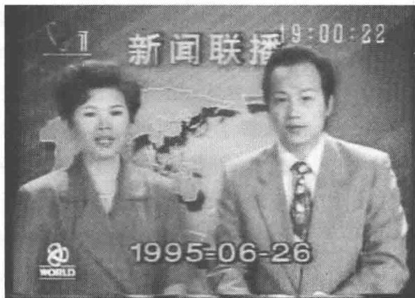
图 1-2 中央电视台《新闻联播》主播邢质斌和罗京在播音