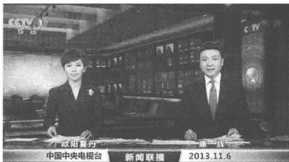
图 1-3 中央电视台《新闻联播》主播欧阳夏丹和康辉在播音