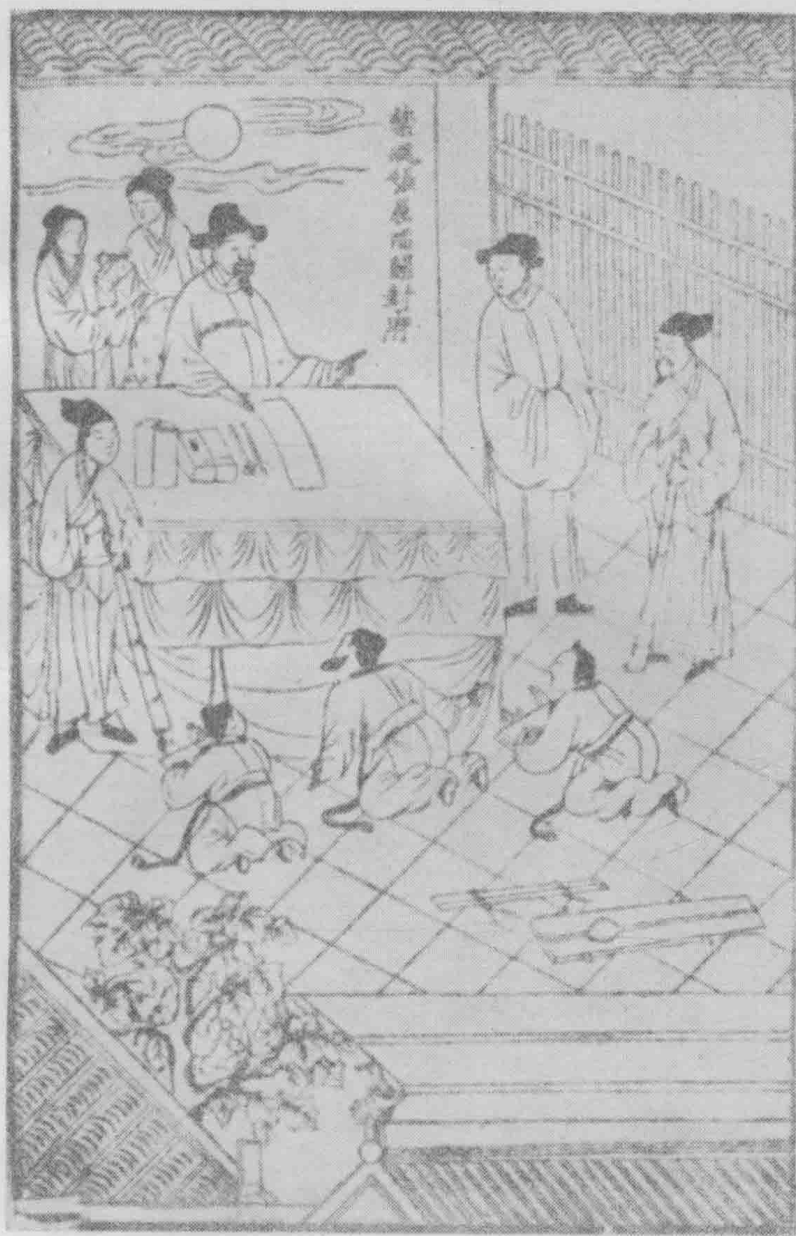
禁魂张屈陷开封府。(第三十六卷)