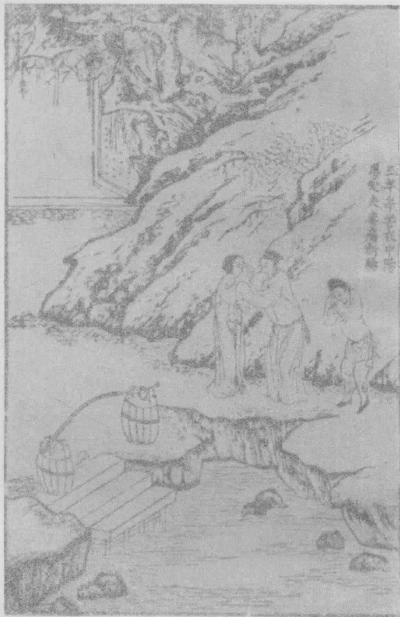
三年辛苦在申阳，恩爱夫妻痛断肠。（第二十卷）