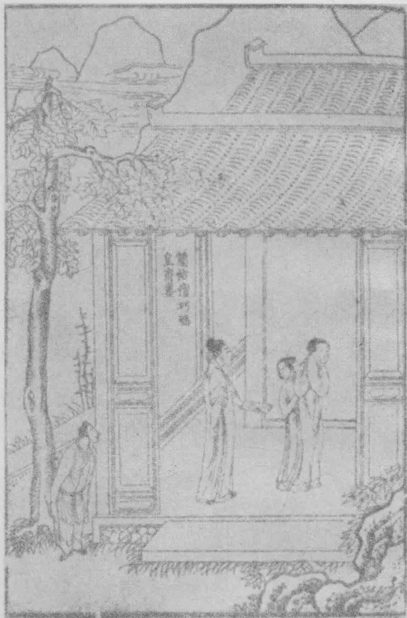
筒帖僧巧騙皇甫妻。(第三十五卷)