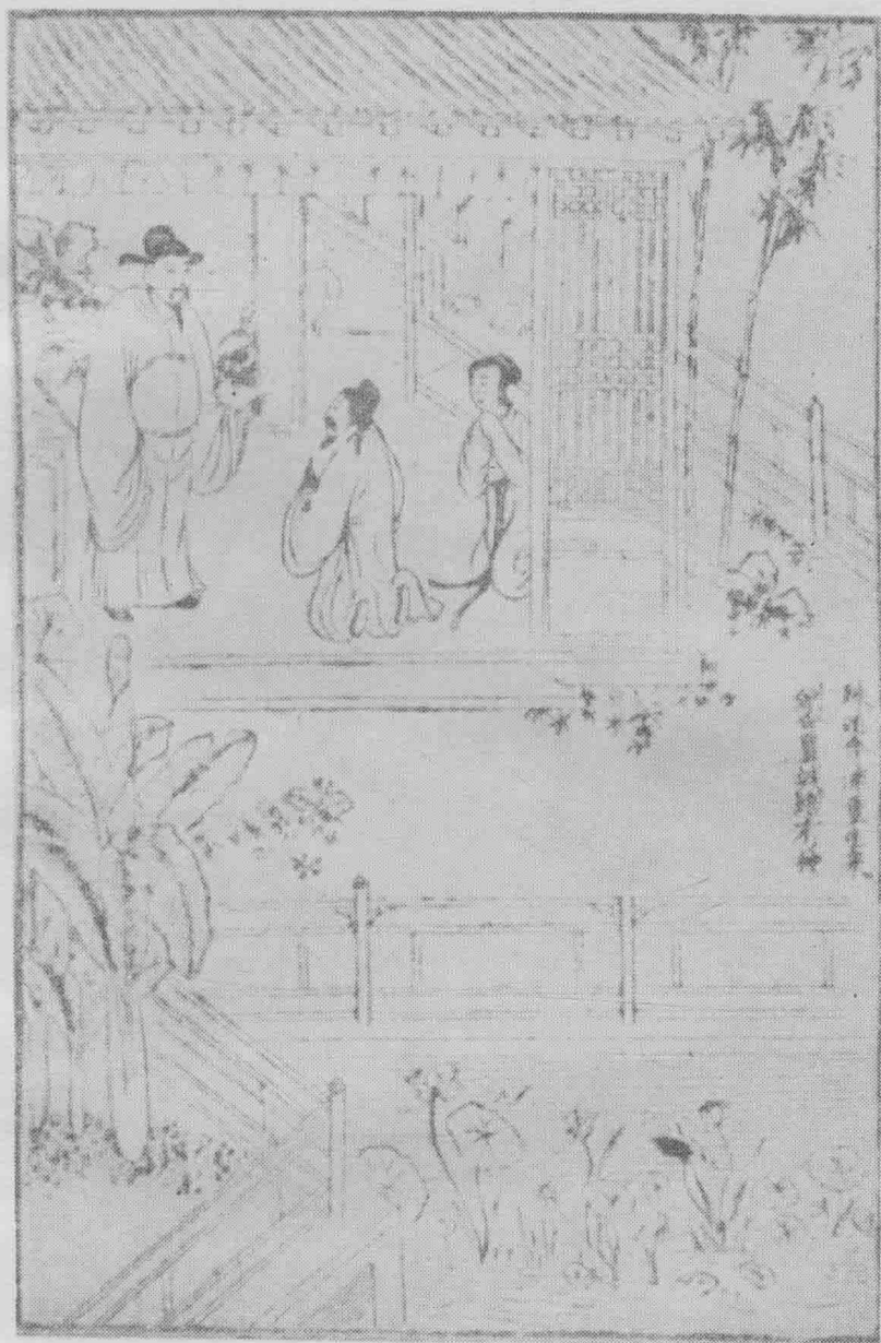
珠还合浦重生采，劍合丰城倍有神。（第一卷）