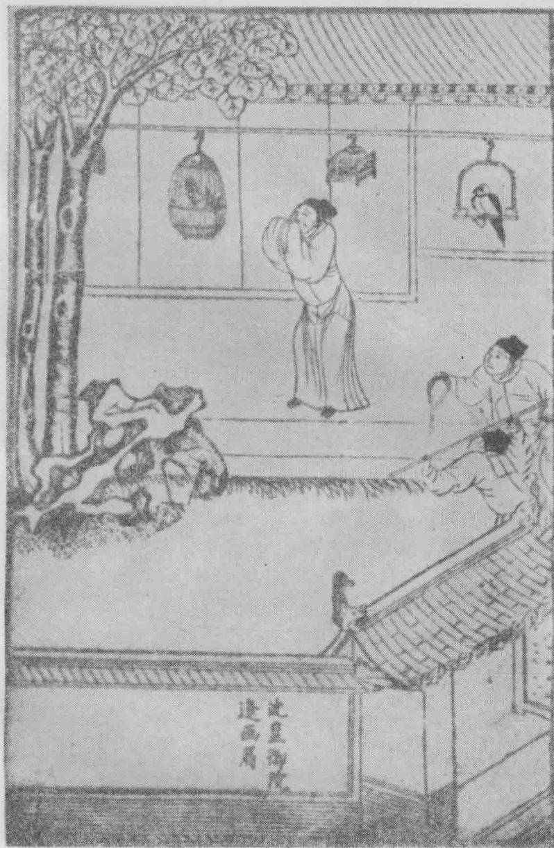
沈昱御院逢画眉。(第二十六卷)