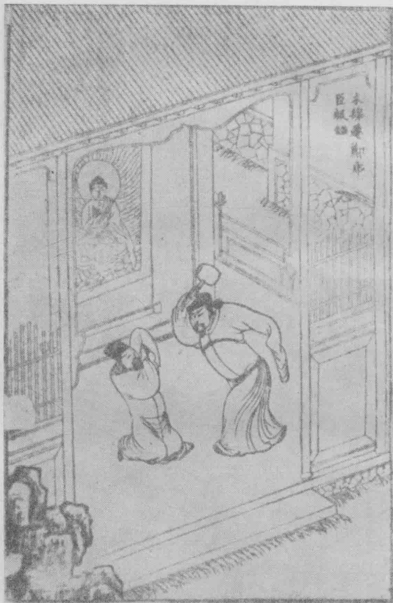
木綿庵邦虎臣報謝。(第二十二卷)