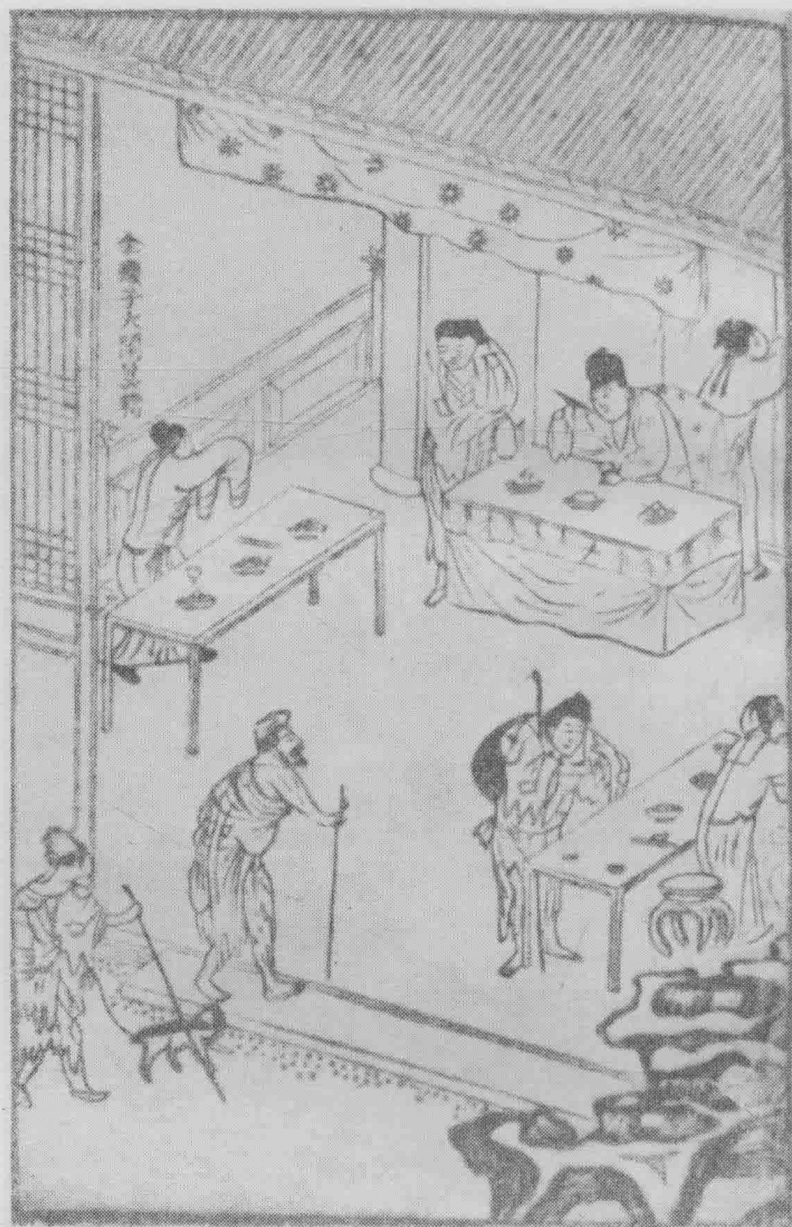
金瓶子大闹莫稽。(第二十七卷)