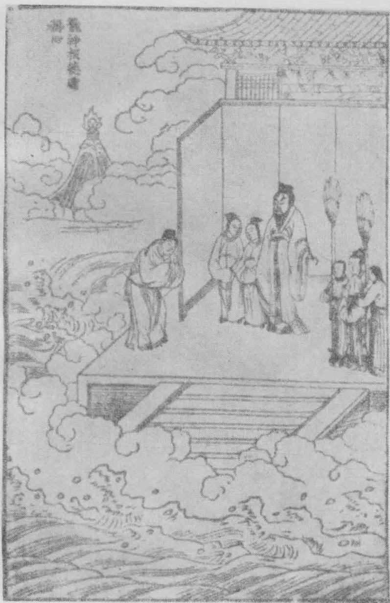
龙神报德赠称心。(第三十四卷)