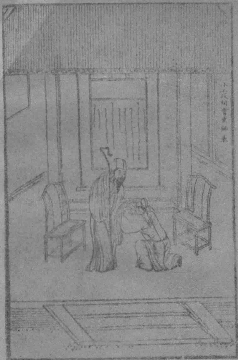
小霞相会出师表。(第四十卷)