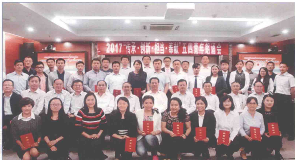
■ 2017年5月，国务院南水北调办机关团委会同机关工会、妇工委举办纪念共青团建团95周年表彰暨“传承·创新·担当·奉献”五四青年朗诵会，并对优秀团员、优秀团干部和优秀团支部进行了表彰。