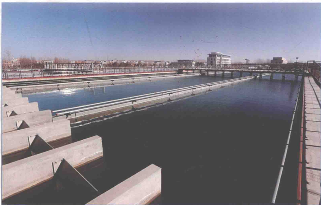
■ 2017年12月，南水北调中线工程受水水厂郑州航空港区二水厂。