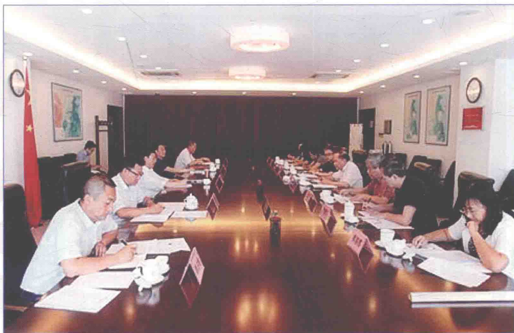
■ 2017年6月，全国人大常委、教科文卫委员会副主任，致公党中央副主席严以新率领调研组到国务院南水北调办调研并召开座谈会。