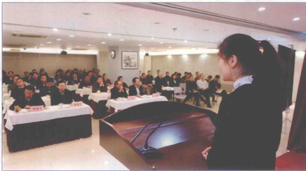
■ 2017年1月，南水北调抗洪抢险先进事迹报告会在国务院南水北调办隆重举行。