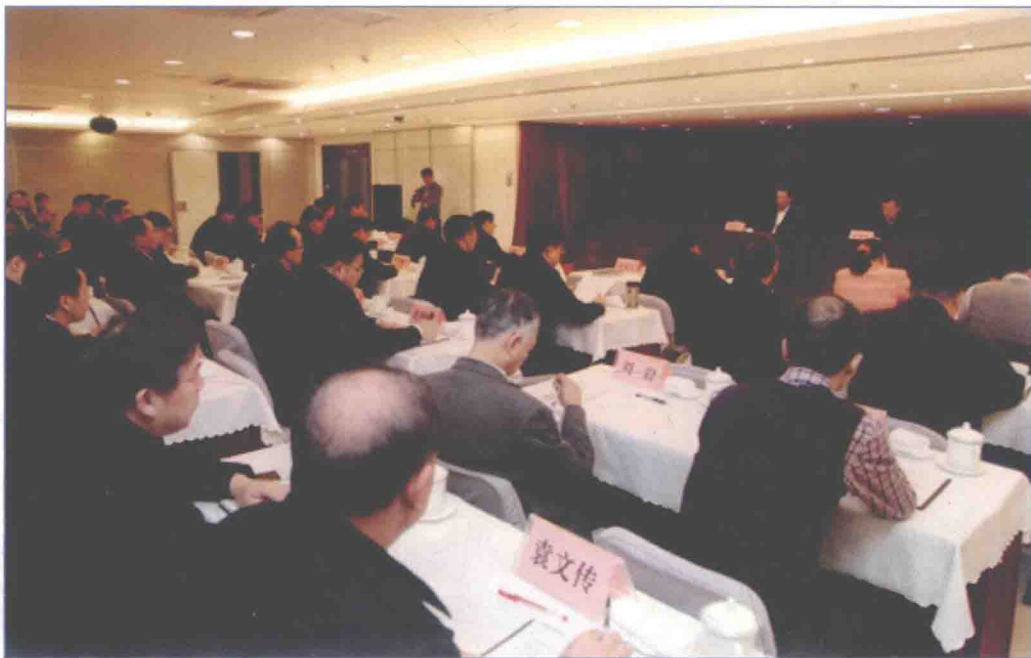
■ 2017年12月，国务院南水北调办召开干部大会，党组书记、主任鄂竟平谈学习贯彻党的十九大精神心得体会，暨为国务院南水北调办第一期处级以上领导干部学习贯彻党的十九大精神专题培训班作专题辅导报告。