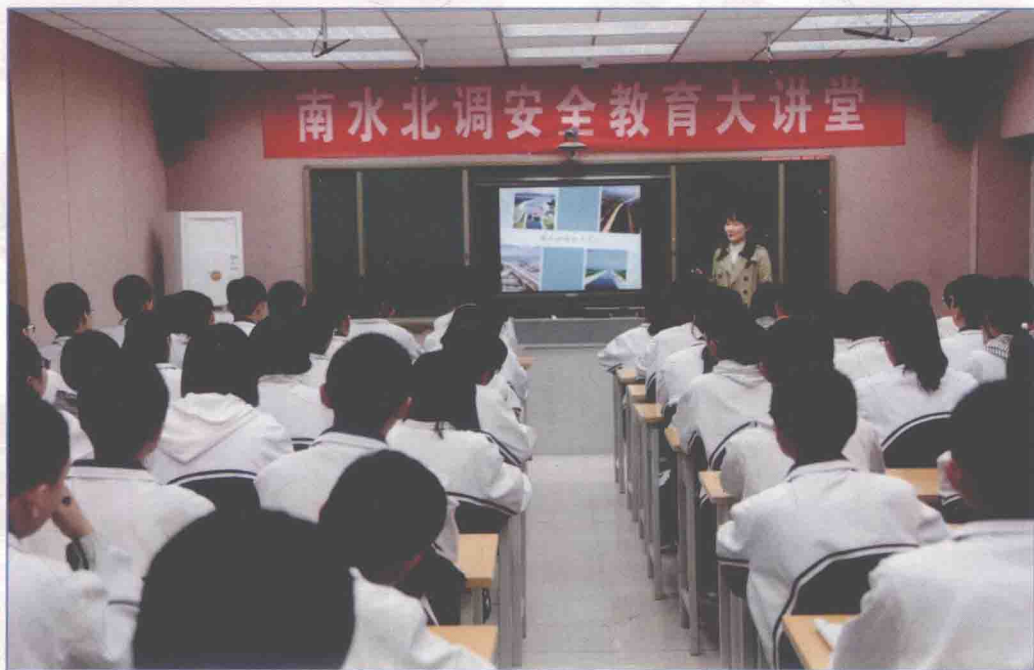
■ 2017年4月，山东干线公司组织到聊城文轩中学开展南水北调安全教育大讲堂活动。