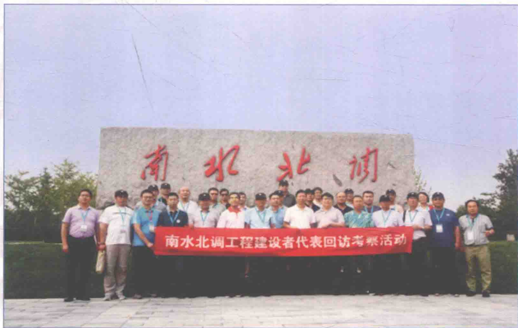
■ 2017年9月，国务院南水北调办成功举办“南水北调一生情”南水北调工程建设者代表回访考察活动。