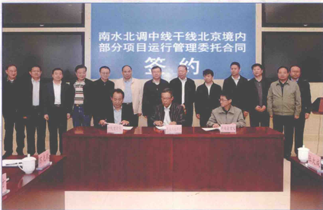
■ 2017年10月，南水北调中线干线北京市境内部分项目运行管理委托合同签约会在北京举行。