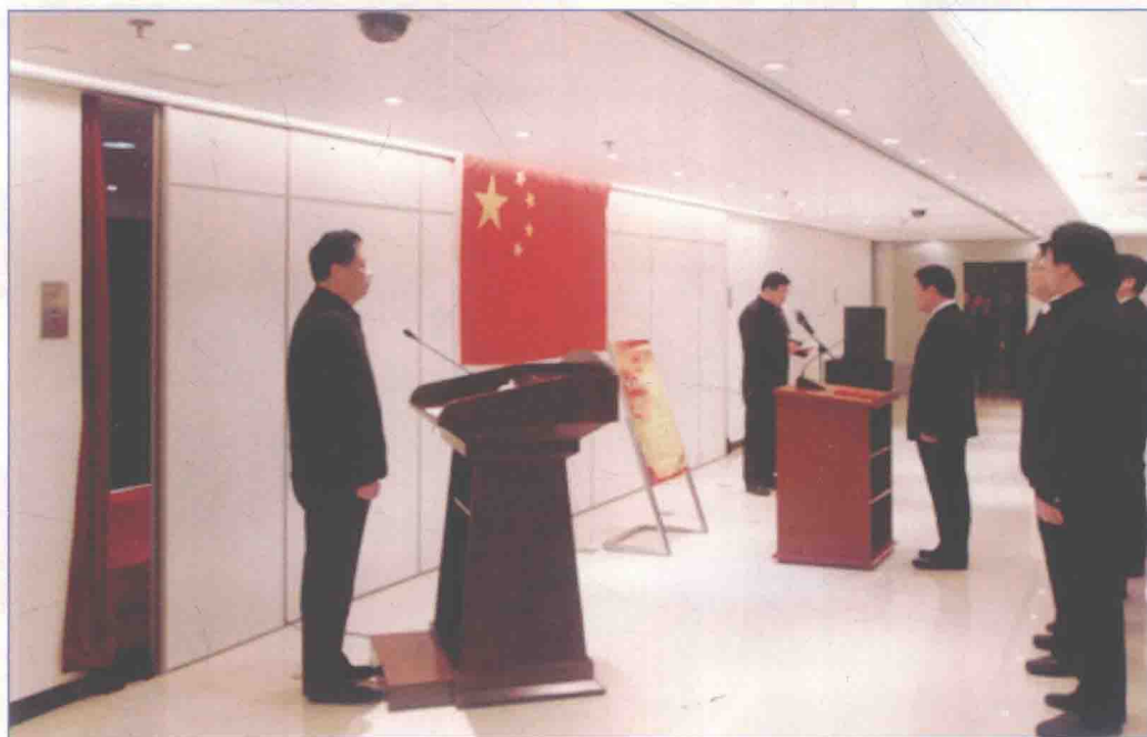
■ 2017年1月，国务院南水北调办首次举行新任干部宪法宣誓仪式。