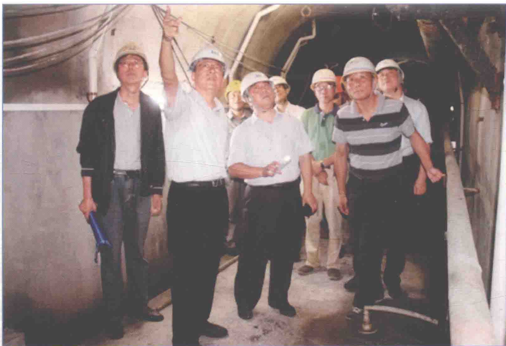
■ 2017年9月，国务院南水北调办副主任张野带队检查南水北调中线丹江口大坝及渠首大坝至方城段工程运行管理情况。