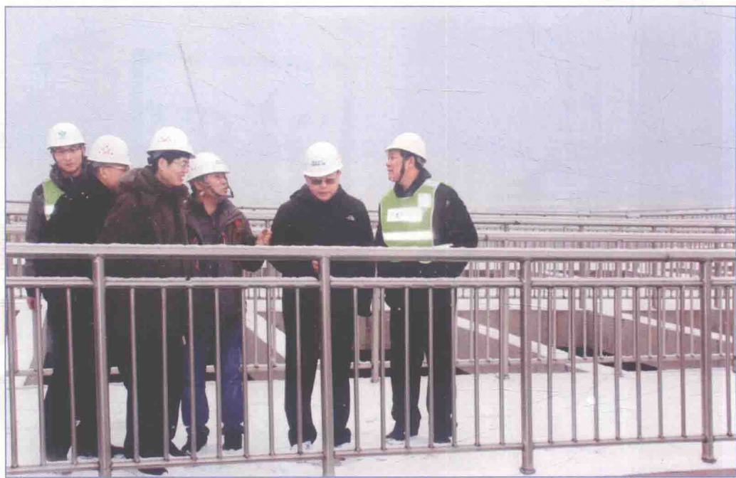
■ 2017年12月，国务院南水北调办副主任蒋旭光带队检查南水北调中线一期工程郟石段部分管理处冰期输水情况。