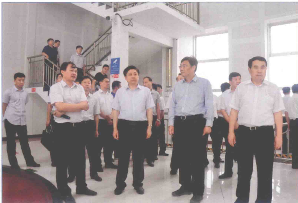
■ 2017年7月，山东省省委副书记王文涛到南水北调东线一期工程长沟泵站视察工作。