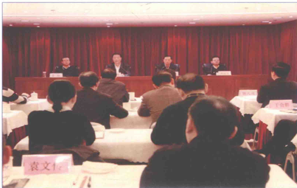
■ 2017年1月，南水北调系统2017年党风廉政建设工作会议在北京召开。