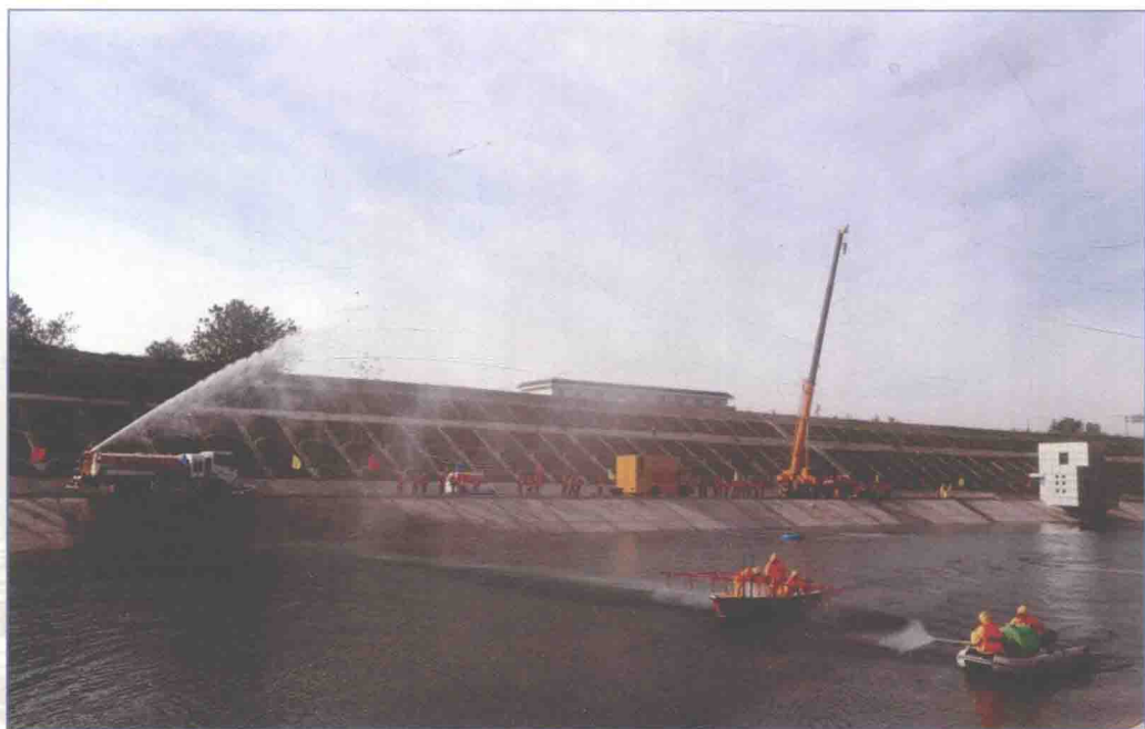
■ 2017年11月，河南省南水北调中线工程突发水污染事件应急演练在郑州举行。