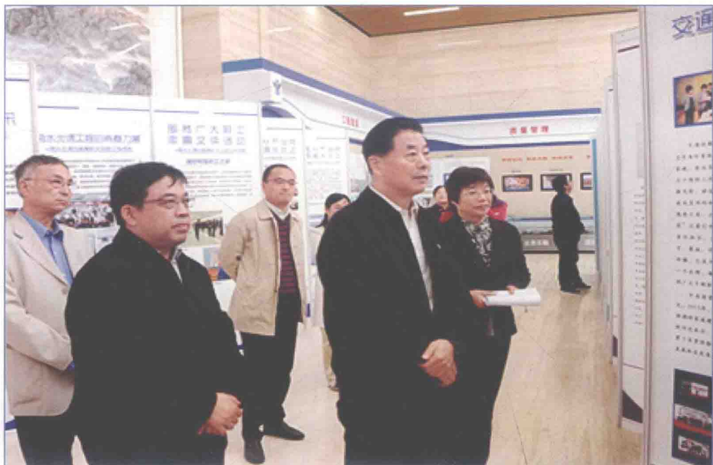
■ 2017年10月，中央国家机关“喜迎十九大·传承好家风”家庭助廉活动成果巡展在国务院南水北调办举办。