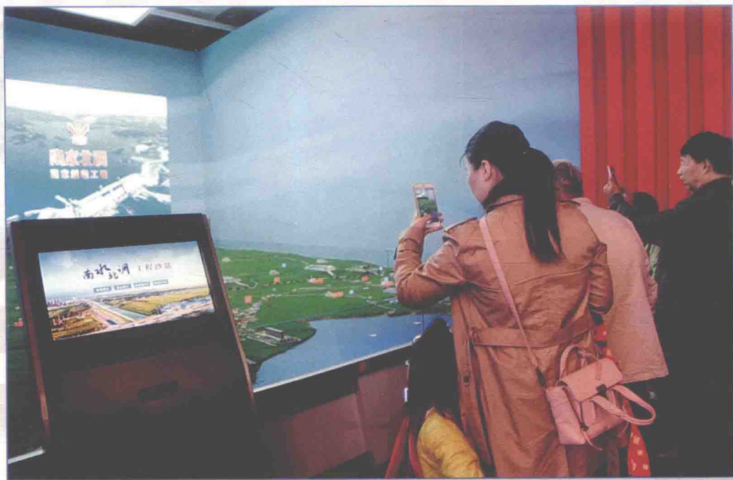
■ 2017年9~12月，南水北调工程参加中共中央宣传部、国家发展改革委等共同举办的“砥砺奋进的五年”大型成就展。