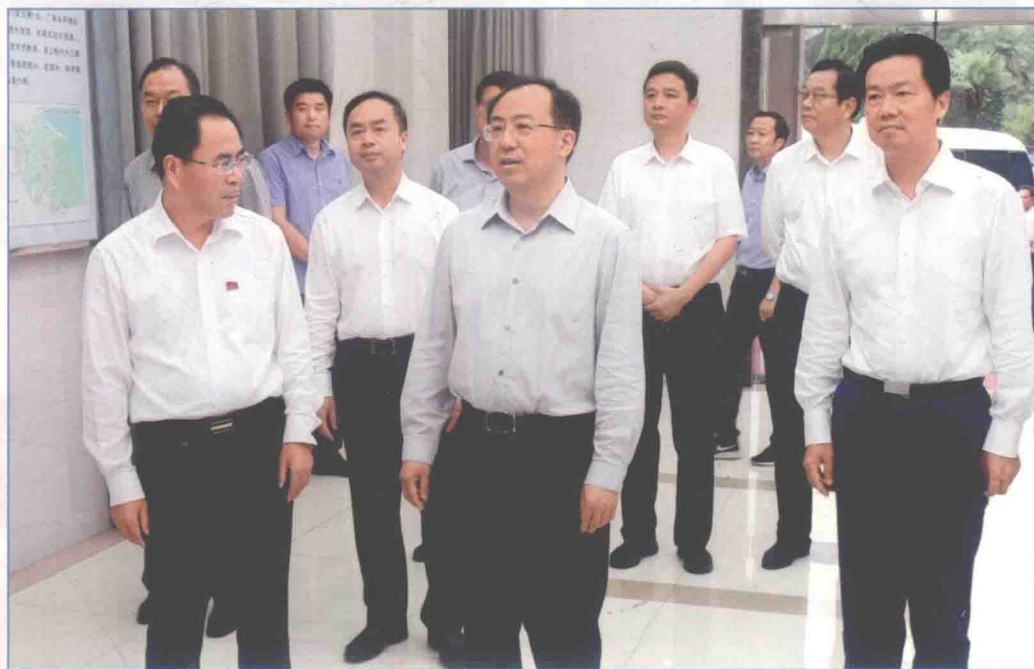
■ 2017年9月，江苏省省长吴政隆检查南水北调东线源头江都水利枢纽。