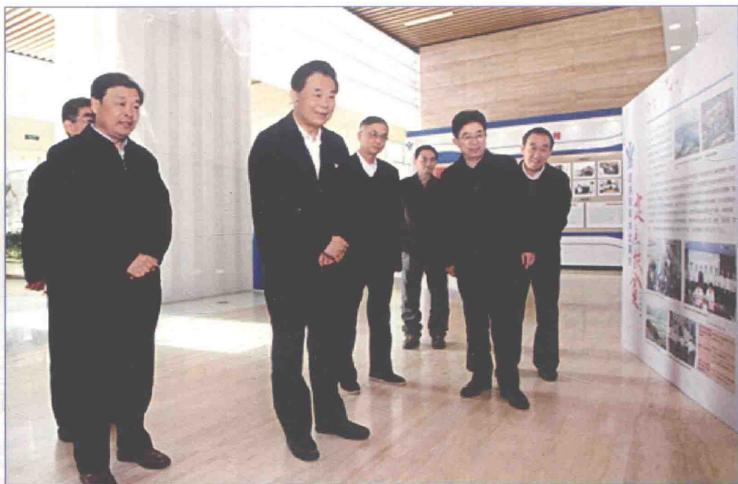
■ 2017年10月，国务院南水北调办定点扶贫工作成果展在国务院南水北调办机关举办。