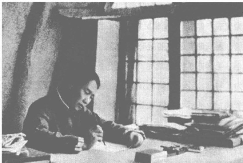
毛泽东在窑洞中写作

为了学习宣传马列主义，提高全党的马列主义水平，毛泽东带头学习马列、宣传马列，全党掀起了学习热潮，组建了许多学习团体与学习小组、举办了许多学习讲座、出版了许多马列著作。