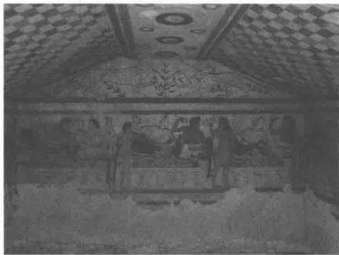
伊特鲁里亚人宴会的壁画

伊特鲁里亚人生活在伊特鲁里亚，他们是一个民族成分和渊源都不确定的民族，过着富有、文雅和靠海而生的日子，现在，这里又因为他们而被命名为托斯卡纳（Tuscany）。 ① 他们看似是通过海路从东面进入意大利的。罗马人崛起之前，他们就是这个半岛居于领导地位的民族。其文化中的某些元素使我们相信，他们从希腊殖民区的城市那里获益良多。伊特鲁里亚人接着又成了早期罗马人的老师，传授给他们文明的某些元素，包括军事惯例、建筑艺术方面的启发以及各种各样的宗教观念和仪式。