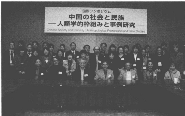
照片1 国立民族学博物馆2楼第4会议室 2012年11月25日

本次会议有两个目的。第一是探讨有关家族、民族、国家的话语及其动态的人类学理论框架。中国是一个文明历史悠久、政权不断交替而其结构又是相对稳定的社会。面对这样一个复杂的社会，人类学者在研究文化的制度、结构和功能的同时，也应注重研究其文化的生成、延续和变容的过程。因此，解释文化的结构和动态的有效框架一直是人类学者不断追求的目标。家族、民族、国家是人类社会的普遍现象。尤其在中国，家、族、民族、国、国家等概念和话语形成了基本的社会关系，并影响和制约着人们的各种社会实践。它们是贯穿中国历史，形成文化的连续性和断