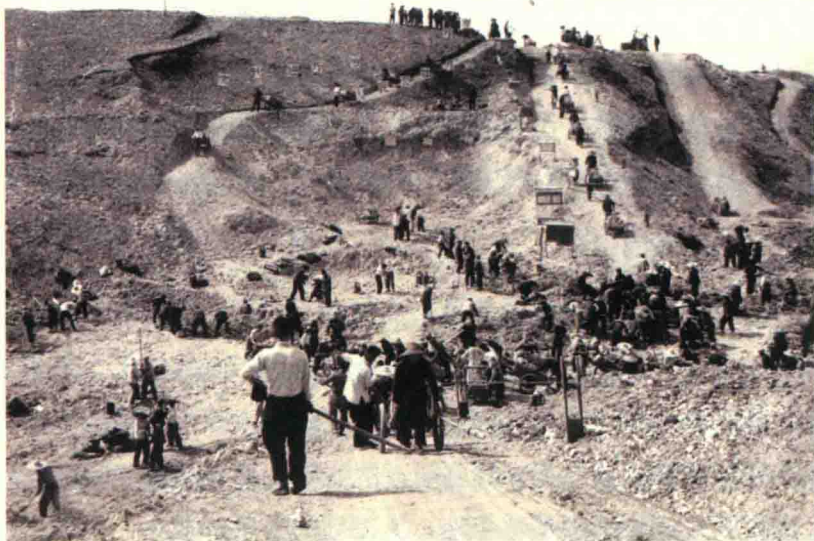
漳河水库第二干渠建设时的场景

在中华人民共和国成立之初，百废待兴。当时党中央采取有力措施，严厉打击社会上的歪风邪气、流氓地痞、嫖娼、吸毒、赌博、盗窃等等，并将它们彻底清除，社会呈现出风清气正、夜不闭户的良好氛围。当然，这个时期我国的社会经济还相当落后，因而在实施第一个五年计划之后，中央提出了“以钢为纲”，发展工业，“以粮为纲”，发展农业的国民经济计划。经过几年的努力奋斗，社会经济有了较明显的发展，呈现出了一派欣欣向荣的景象。然而，天有不测风云，1959年至1961年，全国遭遇连续三年的自然灾害。当时粮食十分短缺，国家采取了各地区实行粮食与食油依工种、年龄等不同进行定量供应的制度。记得当年我到江陵出差，还需要行政科到粮食部门将武汉市