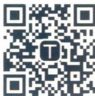
99 读书人 天猫官方旗舰店