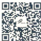
爱阅读的小孩 把世界上最好的童书带给孩子