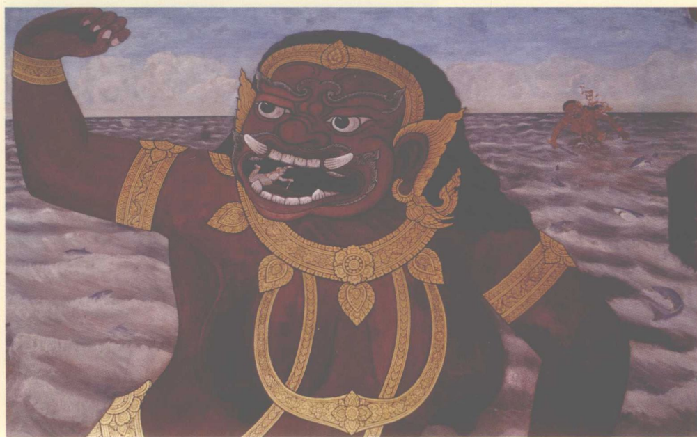
跳进妖魔的肚子——哈奴曼就在妖魔的嘴边（泰国大皇宫《拉玛坚》壁画）