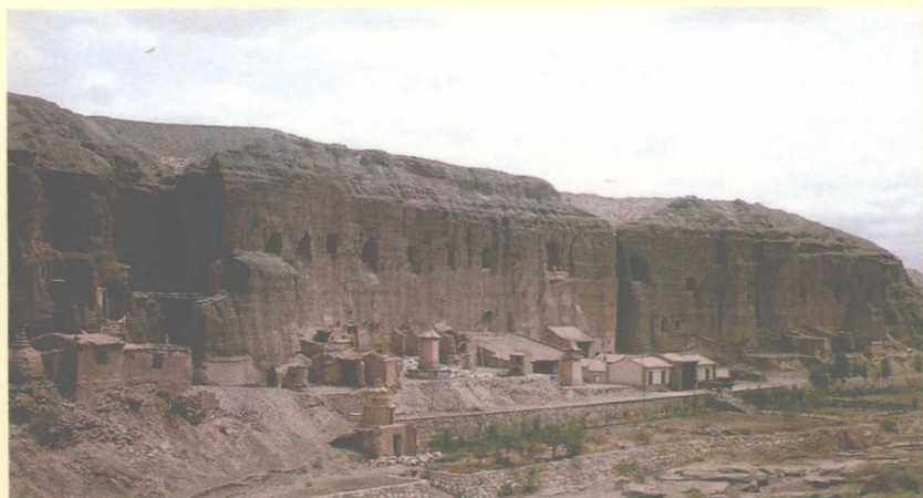
榆林窟早期外景图