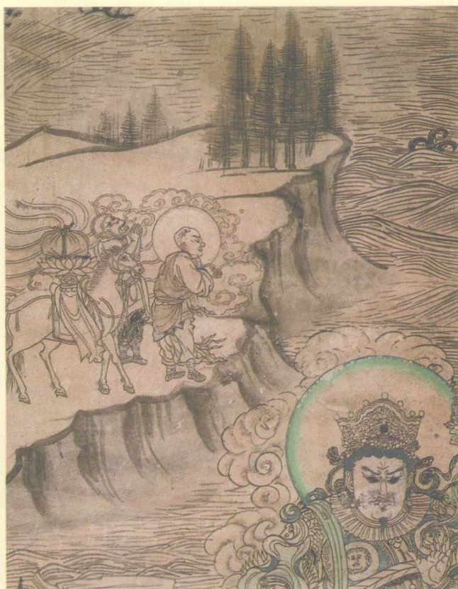
榆林窟第三窟 西夏《唐僧取经》壁画