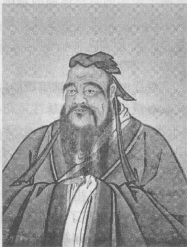
图 1-1 孔子像

孔子(见图 1-1)是中国古代大思想家、大教育家,他首开私人讲学之风,打破贵族垄断教育的局面。他删《诗》、《书》,定《礼》、《乐》,赞《周易》,修《春秋》,为历史文化的整理和保存作出了重要贡献。孔子把“礼”看成是治国、安邦、平定天下的基础,第一次在理论上全面而深刻地论述了礼仪规范。他编订的《仪礼》,详细记录了战国以前贵族生活的各种礼节仪式,是中国古代最早、最重要的礼仪著作。在个人的行为规范上,孔子认为,“不学礼,无以立”、“质胜文则野,文胜质则史。文质彬彬,然后君子”。他要求人们用道德规范约束自己的行为,要做到“非礼勿视,非礼勿听,非礼勿言,非礼勿动”。他倡导的“仁者爱人”,强调人与人之间要有同情心,要互相关心,彼此尊重。总之,孔子较系统地阐述了礼及礼仪的本质与功能,把礼仪理论提高到了一个新的高度。