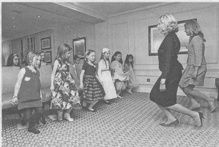
图 1-2 西方礼仪

17~18世纪是欧洲资产阶级革命浪潮兴起的时代，随着资本主义制度在欧洲的确立和发展，资本主义社会的礼仪逐渐取代封建社会的礼仪(见图1-2)。英国资产阶级教育思想家约翰·洛克于公元1693年写作了《教育漫话》，系统地、深入地论述了礼仪的地位、作用以及礼仪教育的意义和方法。德国学者缪南杰斯写作了礼仪专著《论接待权贵和女士的礼仪，兼论女士如何对男士保持雍容态度》。