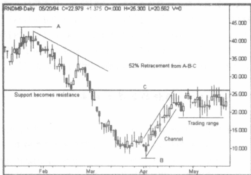
图 1.1 一张随机生成的价格 K 线图

随后，价格沿着一个狭窄的上升通道回升到 26.00 价位水平附近，先前的支撑位变为新的阻力位，价格进入一个箱体区间。26.00 的阻力位标注为 C，其大致位于从 A 点下跌到 B 点的 50% 回档位。可以观察到，在底部附近有锤形线和十字星形态，在箱体中出现的陀螺线（指上、下影线较长，但实体很短的 K 线），以及在顶部出现的吊颈线（指下影线较长、实体较短的 K 线，由于其形状与绞架颇为相似，故而因此得名）。