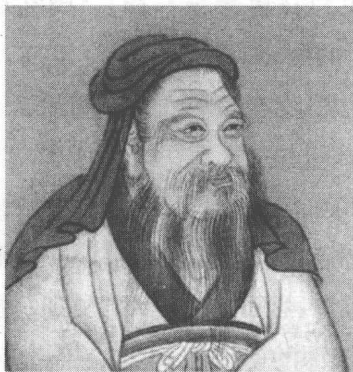
图 1-3 周公姬旦