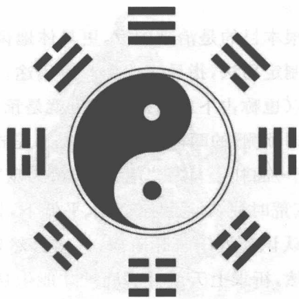
图 1-2 八卦图

易》即是周朝的易经,因此简称《周易》;另一种看法认为“周易”的“周”是指周全、周而复始、循环往复、无所不有的意思。但不管是哪种解释,都公认《周易》始自周文王姬昌。