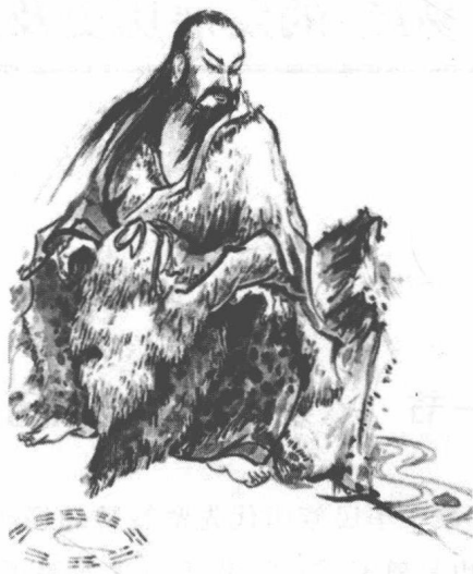
图 1-1 伏羲画八卦