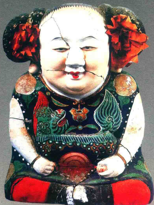
阿福（清代）◎惠山泥彩塑