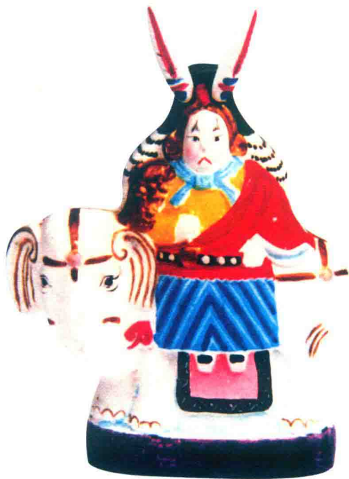
兔爷（双起翔）◎北京泥彩塑