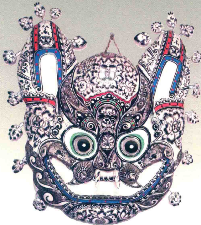
挂虎（胡深）◎凤翔泥彩塑

中国民间泥彩塑植根于中华文化沃土之中，它循系中华文化的优秀文脉，生发繁衍，逐渐形成数量众多、规模宏大、风格迥异的艺术形式。它是世代代人民群众精神力量的体现，是高度智慧与卓越创作才能的结晶。