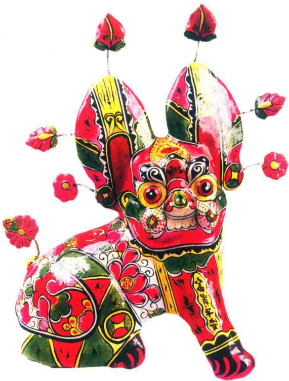
镇宅卧虎（胡永兴）◎凤翔泥彩塑

正是由于中国民间泥彩塑生发于华夏民族的文化土壤的根性，于是在其渐进变化中，它的创作理念、创作方法、工艺程序、审美标准和风格形态，都与中国传统文化一脉相承，也与其渐进中的历史环境息息相关。中国民间泥彩塑在各历史时期受当时社会政治、经济文化等诸多因素的影响，形成不同时期的艺术形式的差异性，这种差异性构成了各个时期民间泥彩塑艺术成因的地域性和风格的多样性，从而留下了中国民间泥彩塑有规律性的历史发展轨迹。这正如美国著名人类学家路易斯·亨利·摩尔根指出的：“我们感到幸运的是，人类进步的事件不依靠特殊的人物而能体现于有形的记录中，这种记录