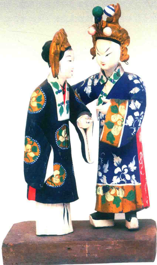
凤仪亭（丁阿金）◎惠山泥彩塑

彩塑，融凝外来艺术日臻创新成熟的隋代彩塑，以细腻完整的手法塑造了雍容丰润的唐代彩塑，还是以写实流畅手法表现人物内心情感、刻画人物性格和形象特征的宋代彩塑，以及求索于生活中人的形态与性格，富于典雅装饰之风的元、明、清彩塑，它们的创作时代与创作条件不尽相同，但所追求的艺术目标是一致的，即造型圆满完整、形态优美生动、色彩纯朴明快。