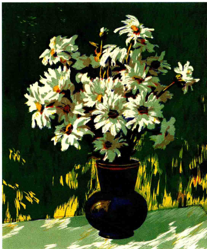
《白色山菊花》 米洛申钦科 (麻胶版套色)