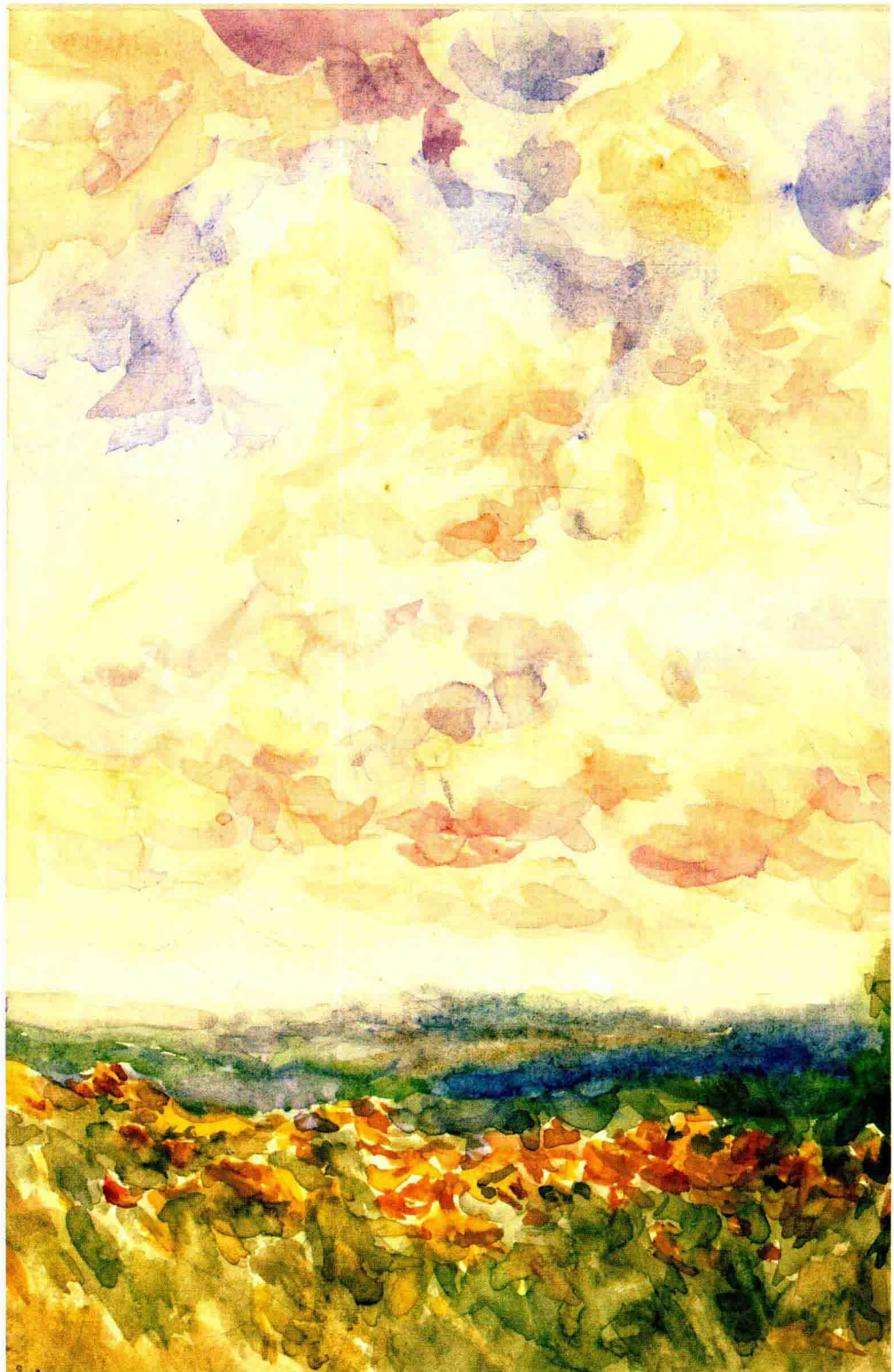
康斯坦丁·莫洛佐夫（水彩写生手稿）