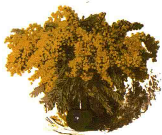
《山花》 瓦涅耶夫（麻胶版套色）