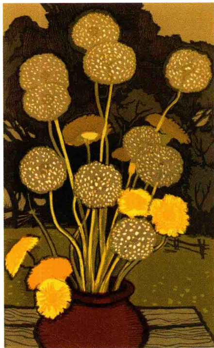
《蒲公英》 特罗申娜 (麻胶版套色)