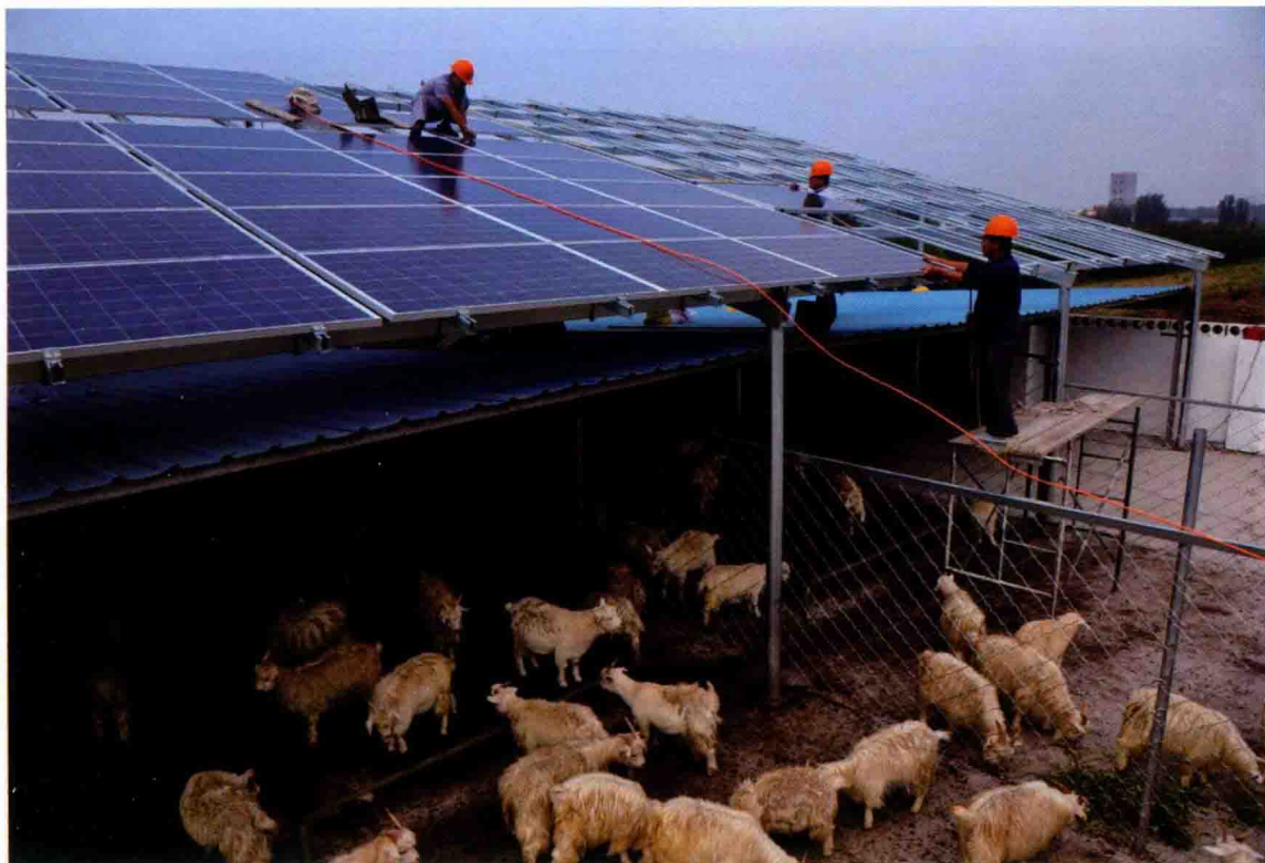
2016年10月9日，在山东省枣庄市山亭区桑村镇忠全养殖场屋顶，工人在太阳能光伏电站施工现场加紧施工。