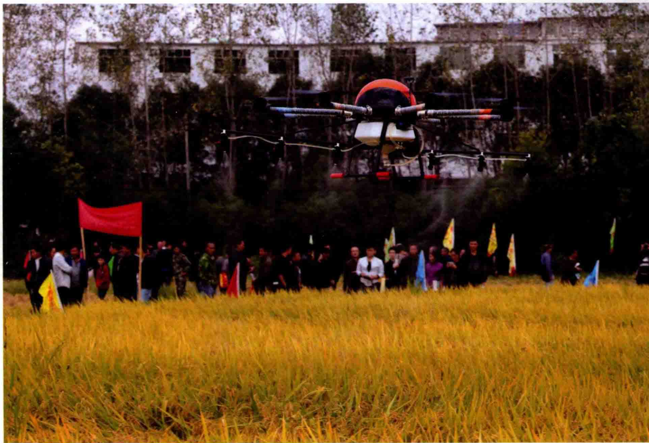
2016年11月3日，江西省东乡县岗上积镇，工作人员在进行植保无人机操作演示。

科技创新已经成为现代国家提高综合国力的关键支撑，成为社会生产方式和生活方式变革进步的强大引领，谁走好了科技创新这步先手棋，谁就能占领先机，在全球竞争中就会赢得优势、主动地位。