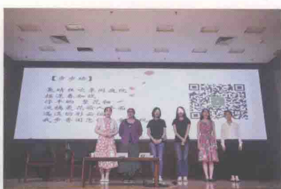
北京师范大学昆曲社表演