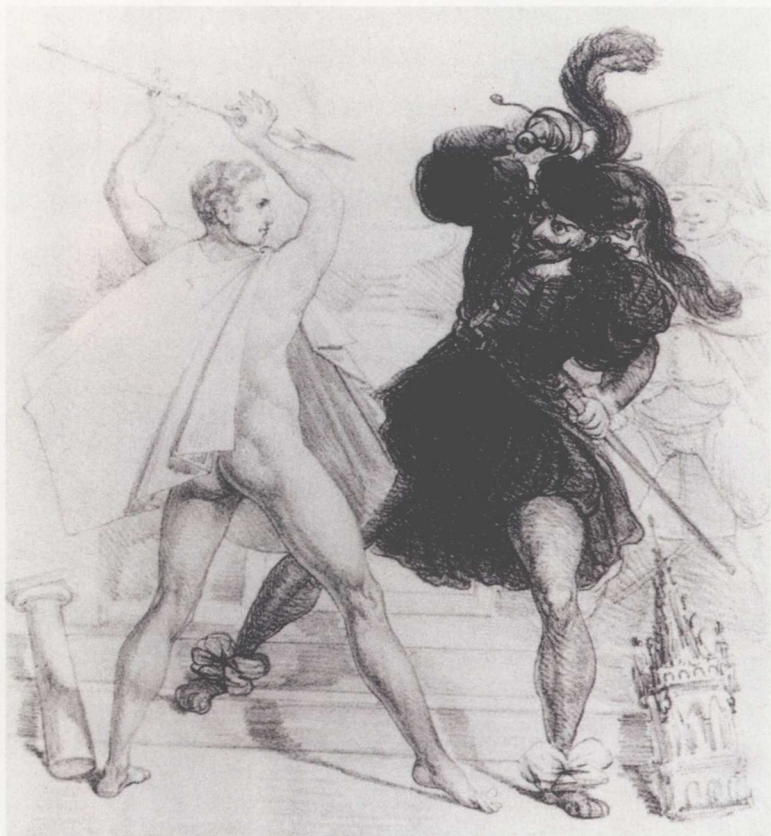
图1 浪漫派与古典派在博物馆门 前的大战 1827年

情感。当德拉克洛瓦以绘画的方式表达这些自由时，他的作家朋友维克多·雨果在文学领域做着同样的事情。同样在1827年，雨果的浪漫主义宣言出现在其英国历史戏剧《克伦威尔》的前言里。这份宣言主张运用各种各样的表达和经验，而非古典戏剧冰冷的形式主义，来反映世界和自我的复杂性；此外，在肯定那些为人欣赏的美好事物的同时，它还肯定了那些丑陋或怪异的东西在感官方面的价值。德拉克洛瓦的作品可以看作是在绘画领域的同一工作。在这幅画里，后宫妻妾以肉欲形式体现出来的美，只不过是等着被毁灭。对颜色、肌理而不是外形轮廓的凸显，正好对应着雨果对古典戏剧结构的拒斥。题材虽取自古代，但是并非来源于古希腊-罗马世界，而是来源于东方。这种新的浪漫主义艺术所有的 8 基本元素——暴力、叛乱、异域情调和大胆的尝试——都在这里得到集中体现。