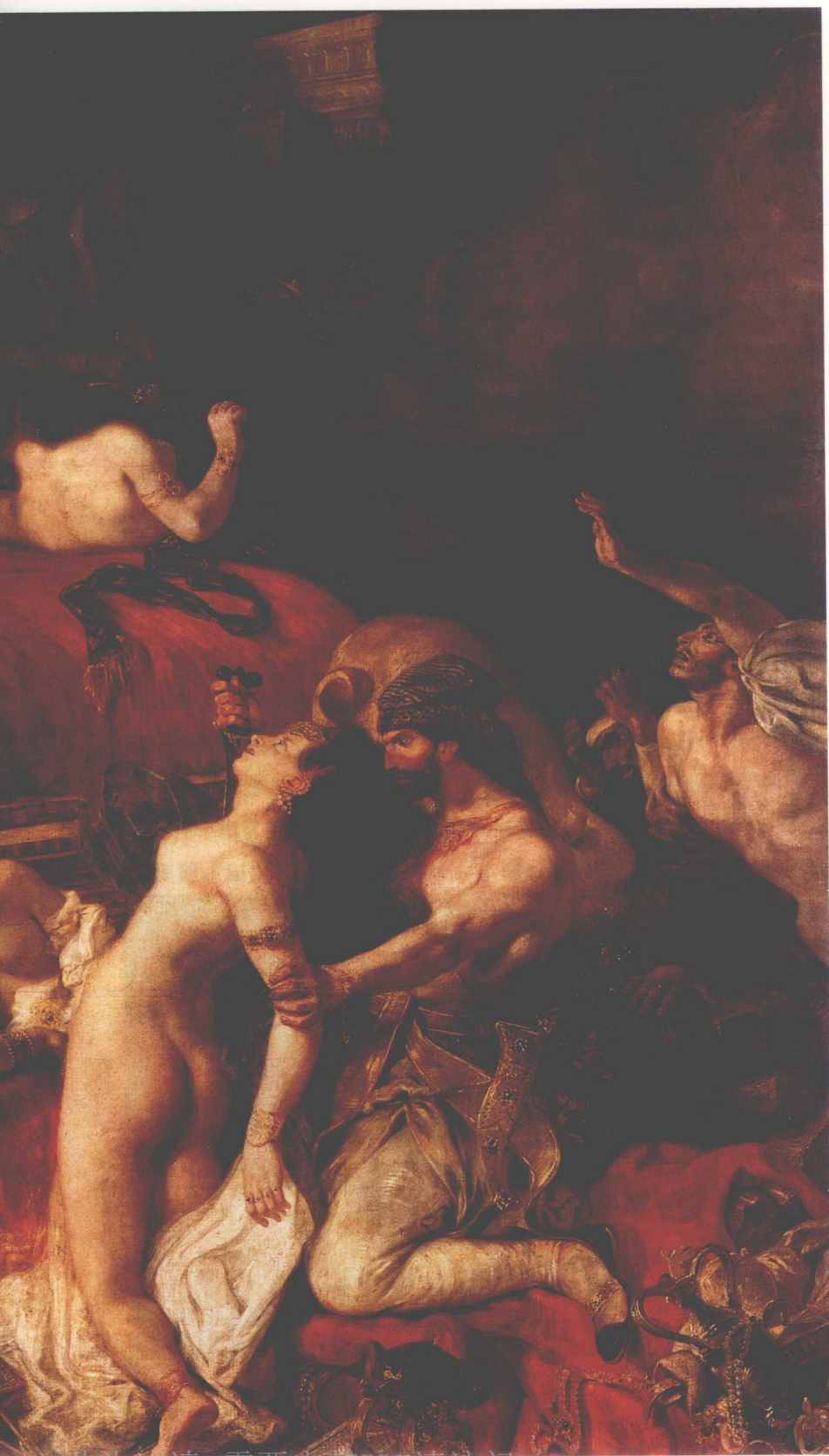
图2 萨丹纳帕路斯之死 欧仁·德拉克洛瓦 1827年 布上油彩 392cm × 496cm 卢浮宫，巴黎