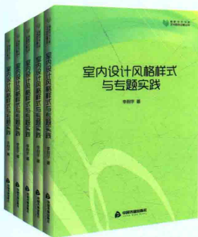
艺术研究论著丛刊