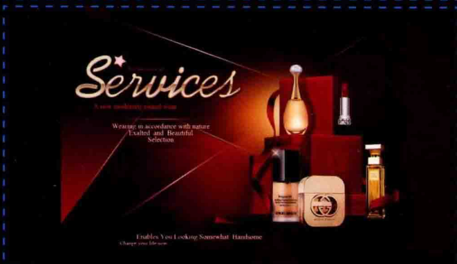
第11章 网店页面绘图 暗红色调轮播图