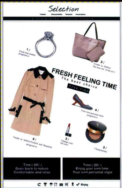
第14章 网店设计综合实战 摩登拼贴感店铺首页