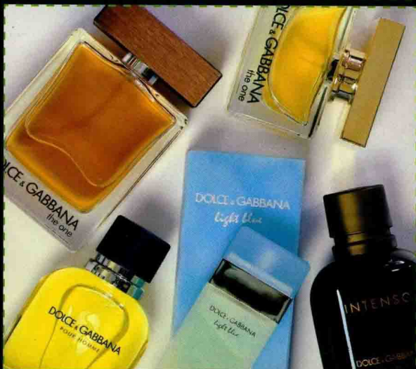
第5章 商品图片的调色美化 使产品图片更鲜艳