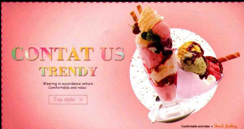
第4章 商品图片的瑕疵去除 使用画笔工具制作甜美色系冰激凌广告