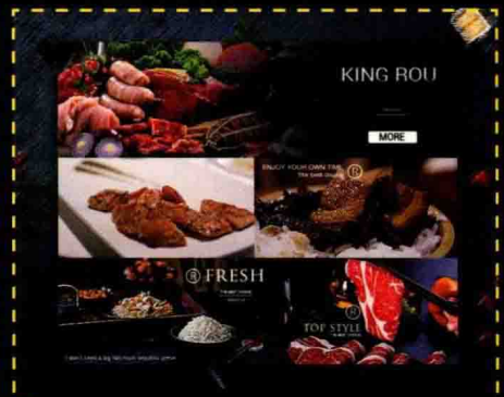
第7章 制作特殊效果的商品图像 暗色调食品类目展示页面