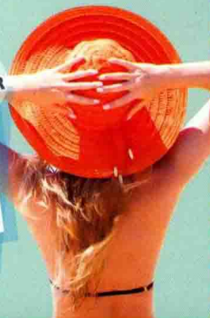
第12章 在网店页面中添加文字 使用文字工具制作夏日感广告

NEW THE BEST CHOICE CASUAL Fresh feel go YOUR