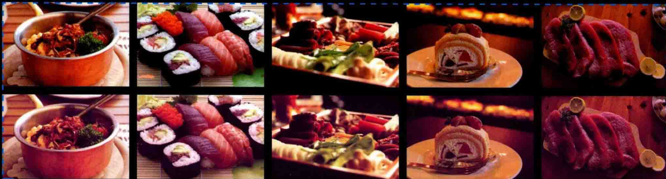
第8章 批量快速处理淘宝图片 批处理制作清新美食照片