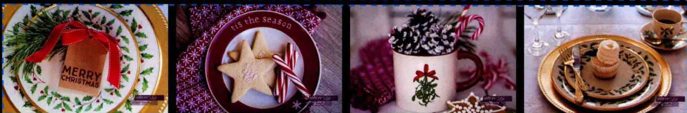
第8章 批量快速处理淘宝图片 为商品照片批量添加水印