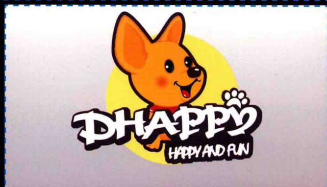
第14章 网店设计综合实战 童装网店标志设计