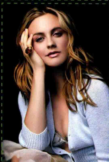
第4章 商品图片的瑕疵去除 制作纯黑背景