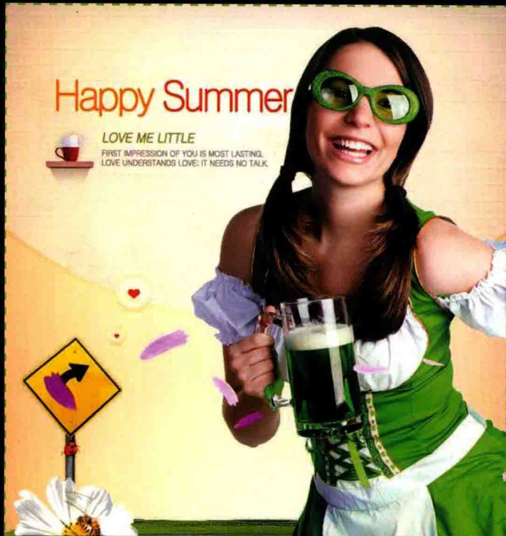
第6章 商品图片的抠图与创意合成 使用磁性钢笔工具为人像更换背景