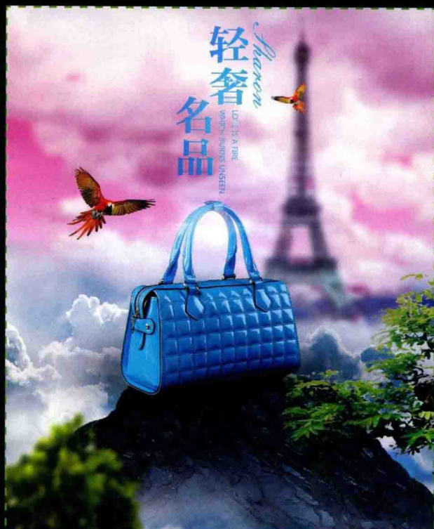
第6章 商品图片的抠图与创意合成 制作箱包创意广告