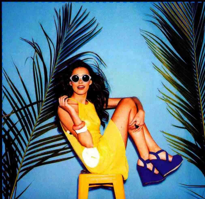
第3章 商品图片的基本处理 修改图像大小制作产品主图