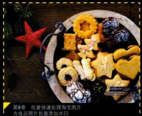
第8章 批量快速处理淘宝图片 为商品照片批量添加水印