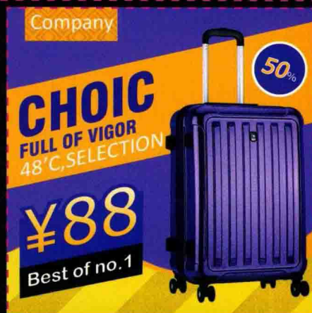
第7章 制作特殊效果的商品图像 动态商品展示图