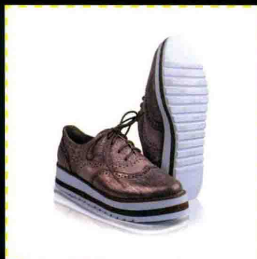
第6章 商品图片的抠图与创意合成 制作不规则对象的倒影