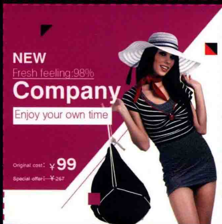
第11章 网店页面绘图 家居产品主图