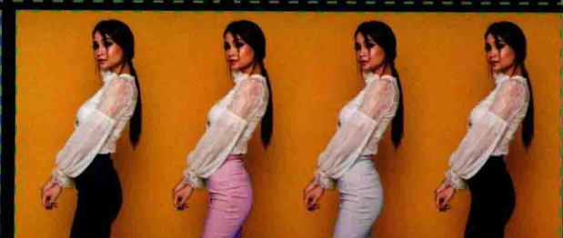
第5章 商品图片的调色美化 改变裙子颜色