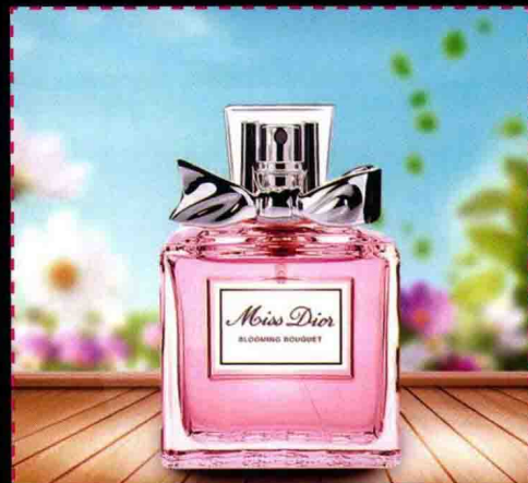
第4章 商品图片的瑕疵去除 使用画笔工具绘制阴影增强画面真实感