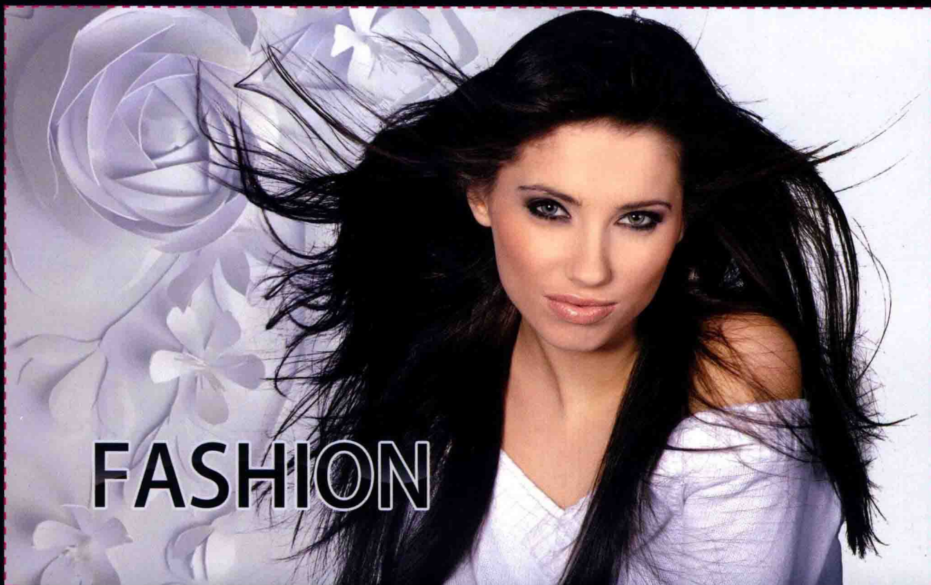
第6章 商品图片的抠图与创意合成 使用“选择并遮住”为长发模特换背景