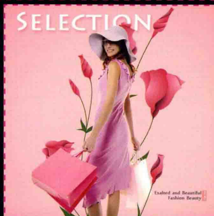
第12章 在网店页面中添加文字 清新风格服装主图