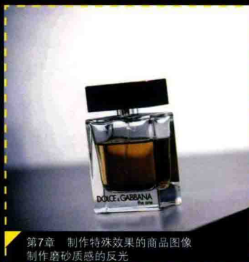
第7章 制作特殊效果的商品图像 制作磨砂质感的反光