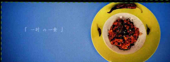
第5章 商品图片的调色美化 美化灰蒙蒙的商品照片