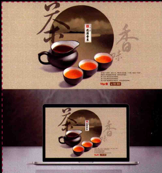
第14章 网店设计综合实战 中式风格产品广告