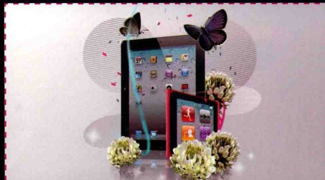
第6章 商品图片的抠图与创意合成 使用魔棒工具去除背景制作数码产品广告