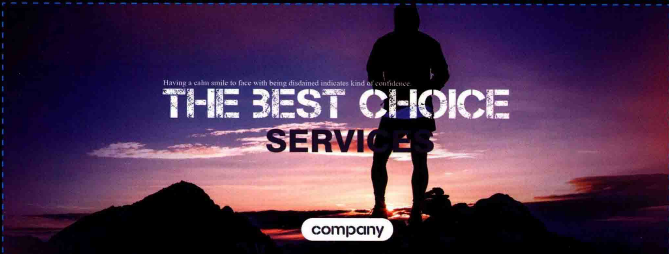
第11章 网店页面绘图 男士运动装通栏广告