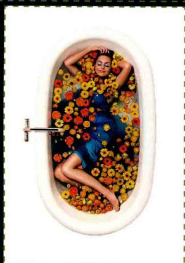
第6章 商品图片的抠图与创意合成 去除抠图之后的像素残留