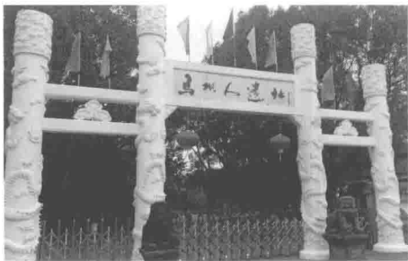
位于韶关曲江的马坝人遗址。马坝人是距今十多万年前岭南古先民。

多族群和多民族的分布成就了岭南极其复杂和异常丰富的方言类型、方言资源。主要方言有广东话（也