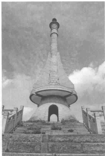
位于广州市从化区的北回归线标志塔