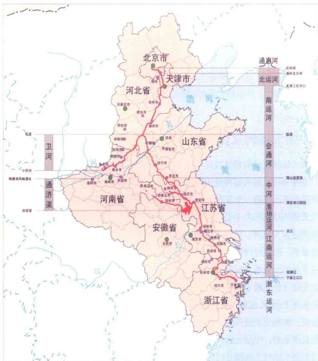
图 1-1 中国大运河区域图

随着申报世界遗产工作的进程，专家发现用京杭大运河不能涵盖整个大运河，于是提出了中国大运河的概念，而 2008 年在扬州成立大运河保护与申遗城市联盟时，参与的城市只有隋唐大运河和京杭大运河沿线 33 座城市，也就是说，大运河包括的范围只是隋唐大运河和京杭大运河。直到 2009 年，从文化遗产发展的战略出发，提出了将浙东运河列入中国大运河，这样可以通过中国大运河将沙漠丝绸之路和海上丝绸之路连接在一起，形成我国对内对外经济文化交流的闭环。因此浙东运河沿线的宁波、绍兴也加入大运河保护与申遗城市联盟。这时完整的中国大运河的概念才出现。必须提醒的是，中国大运河在英语中的名称是“The Grand Canal”，不能加上“of China”。