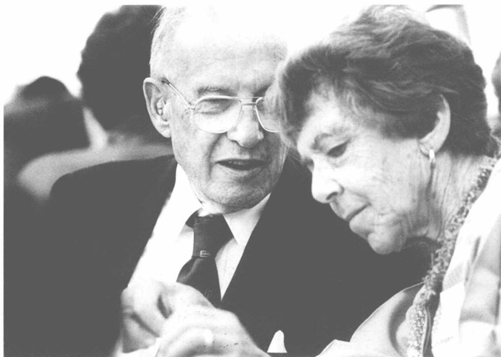
彼得·德鲁克和妻子多丽丝·德鲁克