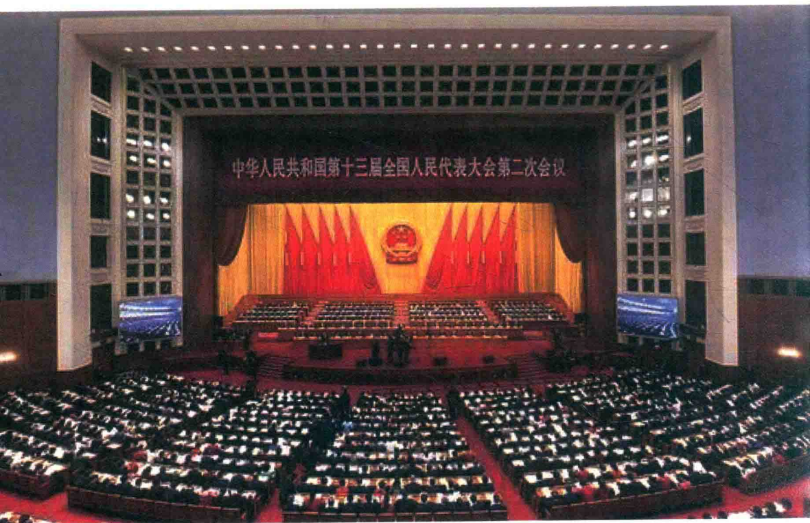
中华人民共和国第十三届全国人民代表大会第二次会议会场