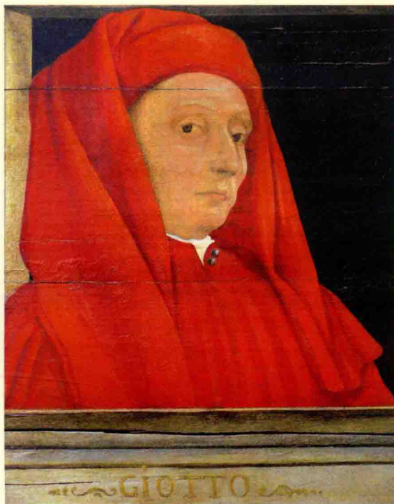
乔托画像 66cm x 21cm

乔托·迪·邦多纳（Giotto di Bondone），西方人称之为乔托，艺术史冠以欧洲近代绘画之父，文艺复兴绘画的 NO.1，咱们可以称之为乔老大。