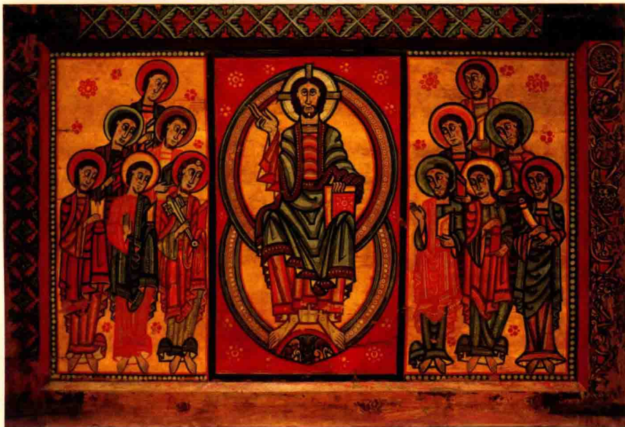
《杜塞尔的祭坛画》佚名 12世纪 102cm x 151cm 西班牙巴塞罗那加泰罗尼亚博物馆

可能有人好奇，何为 拜占庭艺术风格 ？艺术科普一下：它是一种受罗马拜占庭帝国影响而产生的艺术风格，特点是高度的程序化，色彩鲜艳，但人物表情、动作僵硬，类似僵尸，画面平面对称，重装饰，造型扁平，无立体感可言。特别在宗教画上，一个套路，没有个性，画面没有任何光源可言。下面两幅西班牙拜占庭风格木版画可以见真相。