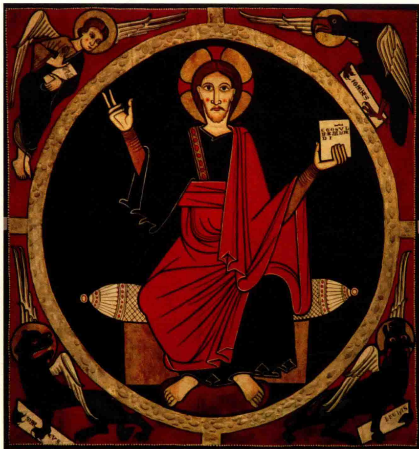
《来自托斯特的华盖》佚名 1220 175cm x 161cm 西班牙巴塞罗那加泰罗尼亚博物馆

乔老大画成什么样子才PK（击败）了拜占庭风格呢？来看看他的代表作——《犹太之吻》。