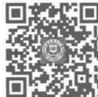
厦门大学出版社 微博二维码