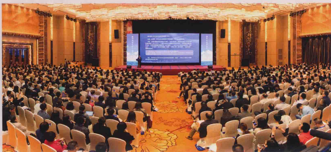
▲ 第八届全国中外合作办学年会现场