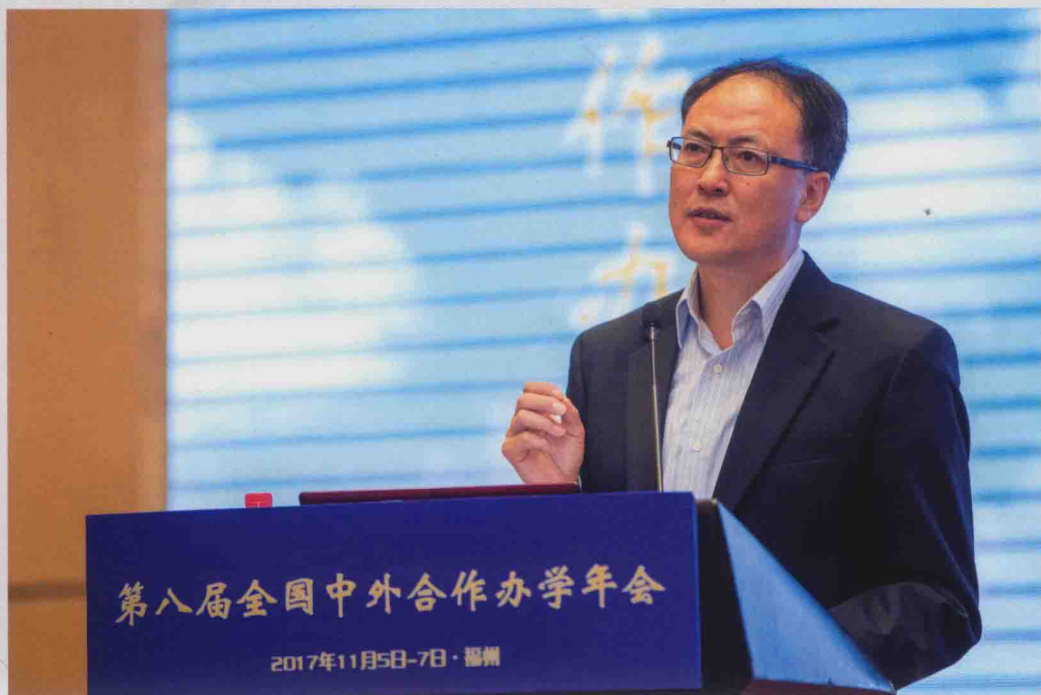
▲ 教育部国际司副司长方军在第八届全国中外合作办学年会开幕式上讲话