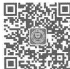
厦门大学出版社 微信二维码