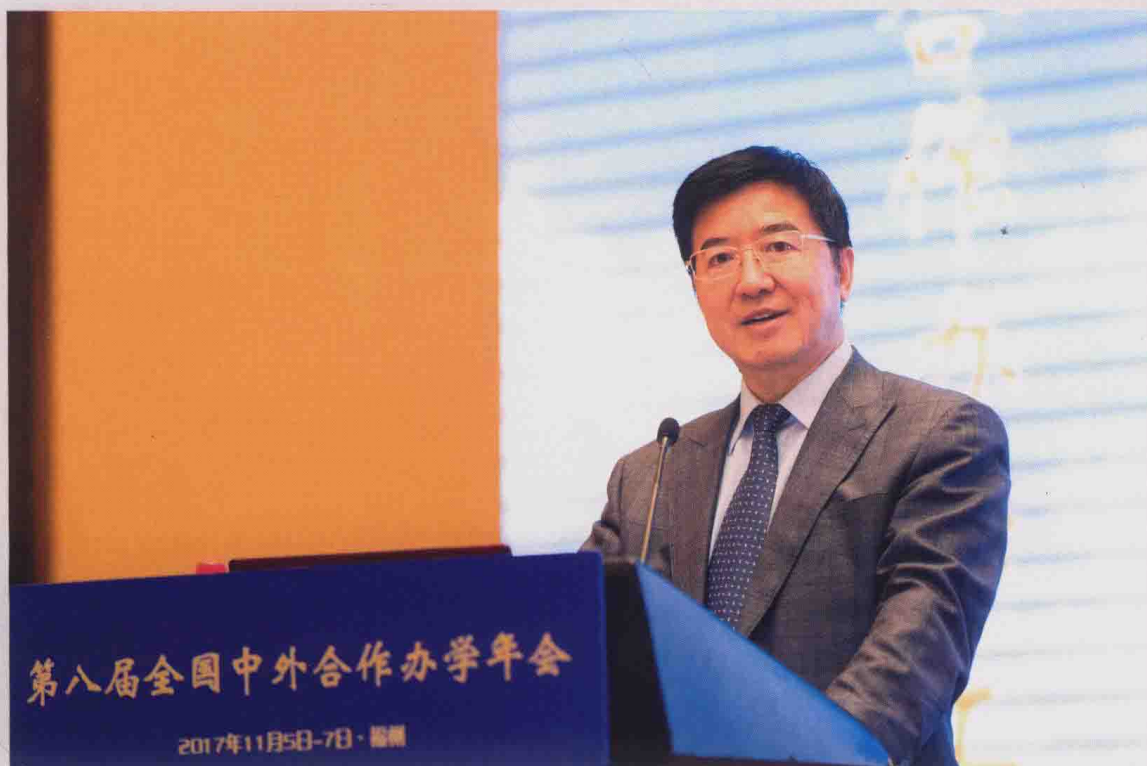
▲ 中国高等教育学会会长，教育部原党组副书记、副部长杜玉波在第八届全国中外合作办学年会开幕式上讲话