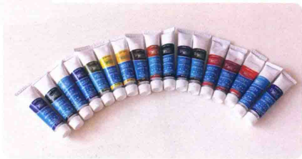
国产温莎牛顿水彩颜料

一种是英国温莎牛顿歌文水彩颜料，特点是对色彩的还原效果好，但是价格偏高，本书的花案例和鸟类的局部基础使用的就是这种颜料。