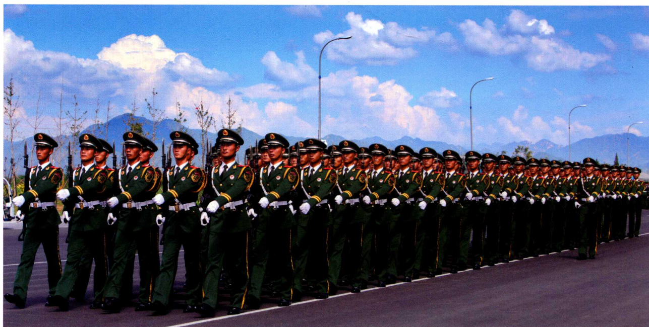
雄赳赳、气昂昂，走向训练场。

阅兵训练，是取得阅兵成功最重要的环节。包括站姿、行进，起步、跑步、正步，向右看、向左看、向前看。头线、胸线、腿线、脚线和枪线，都要整齐划一。这种训练，非常辛苦。当人们看到受阅官兵以刀切般整齐的队形排山倒海般行进时，那是他们顶着烈日、披星戴月、一丝不苟苦练出来的功夫。