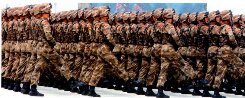
步伐节奏要求一个样。