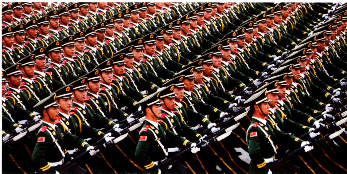
队伍要像平行的波浪。