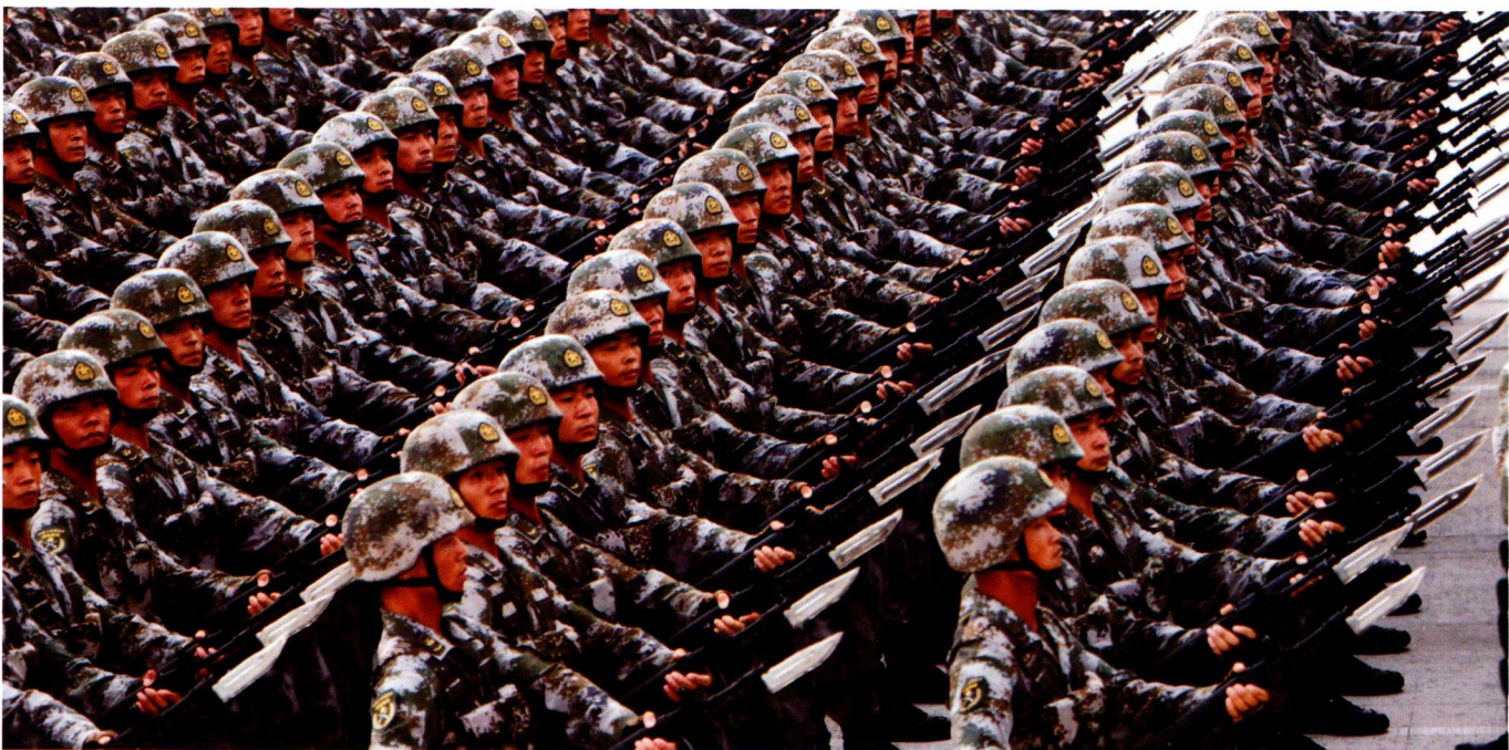
举枪行进要保持队伍的整齐。