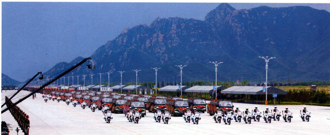
受阅部队排山倒海的气势。