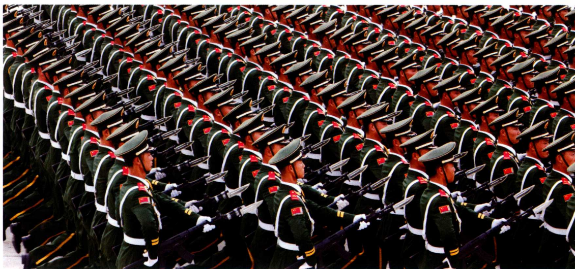
武警官兵的枪刺与肩线。