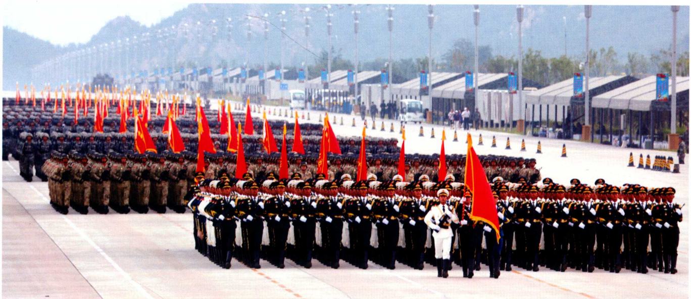
从远处走来的徒步方阵。