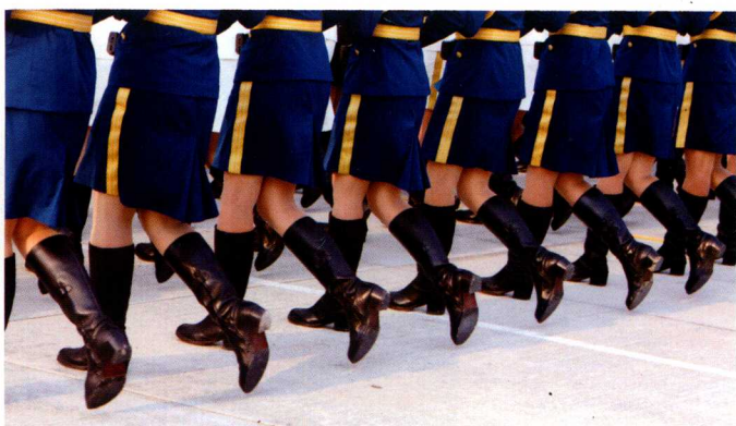
女兵的下肢运动频率要协调。