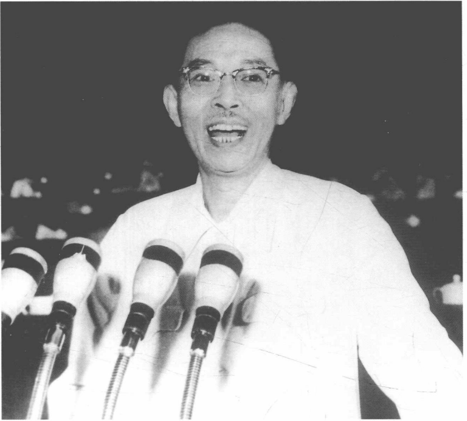
一九六零年七月二十二日在第三次文代会上讲话