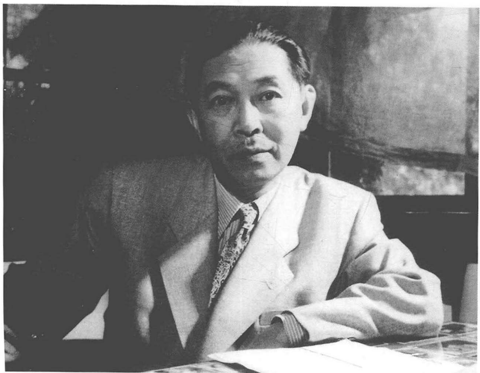
一九六一年春在北京寓所