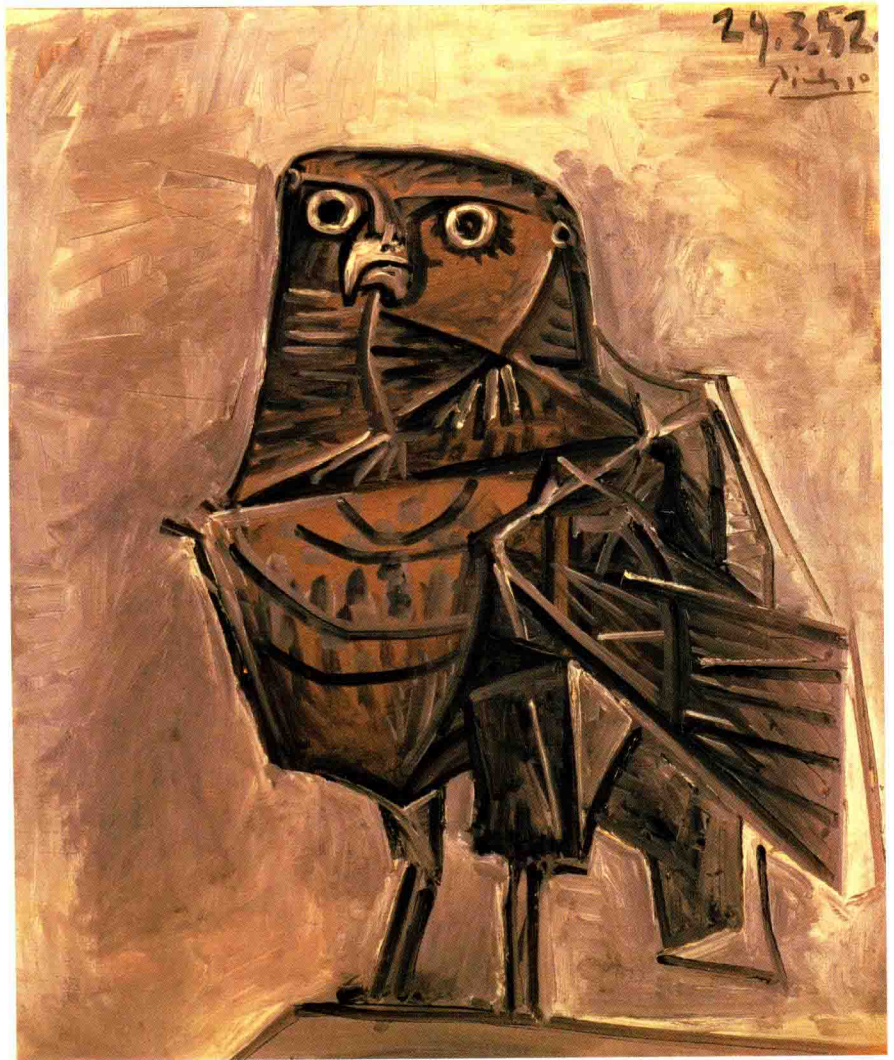
巴勃罗·毕加索，《猫头鹰》，1952年