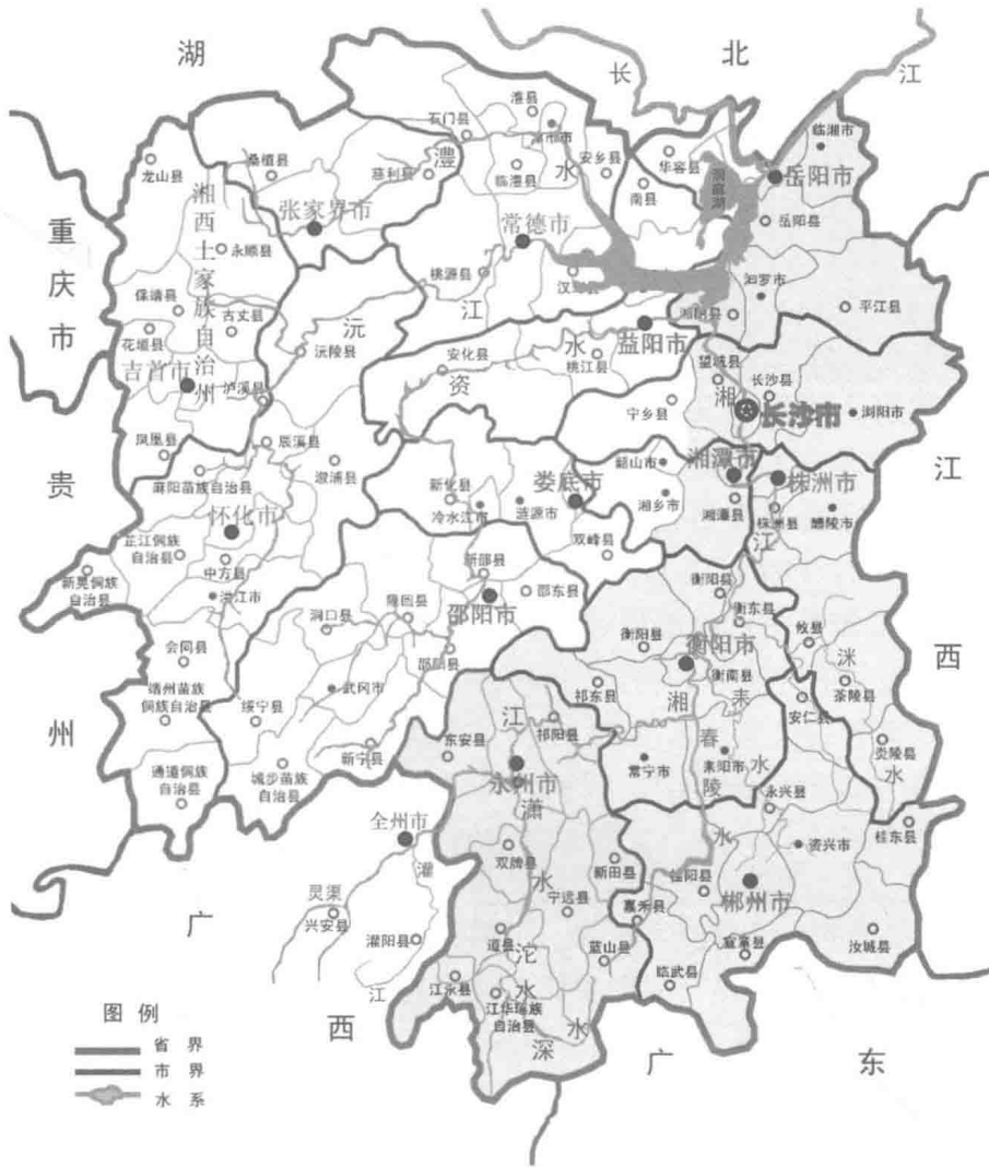
图1-1-2 湘江流域及其主要水系位置图

湘江主要支流自上而下左岸有永明河、海洋河、祁水、蒸水、涓水、涟水、靳江和泅水等;右岸有宁远河、白水、宜水、春陵水、耒水、洣水、淅水、浏阳河和捞刀河等。湘江流域的海拔高度上下游相差不大,但起伏不平,加速了雨水的集流。各支流的上游多曲行于山地之中,表现着山溪河流的特征。湘江上游雨期多暴雨,河谷多呈“V”形,流经山区,谷窄、滩多、流短、水急;湘江中游盆地错落其间,河谷开阔,滩多水浅,水流平稳,河宽250~1000m,常年可通航15~200t驳轮;下游河道蜿蜒曲折,河谷开阔,流量大,河水平稳,浅滩较多,沿河沙洲断续可见,河宽500~1000m,常年可通航15~300t驳轮;长沙以下为河口段,湖泊众多,常年可通航50~500t驳轮 [1] 。