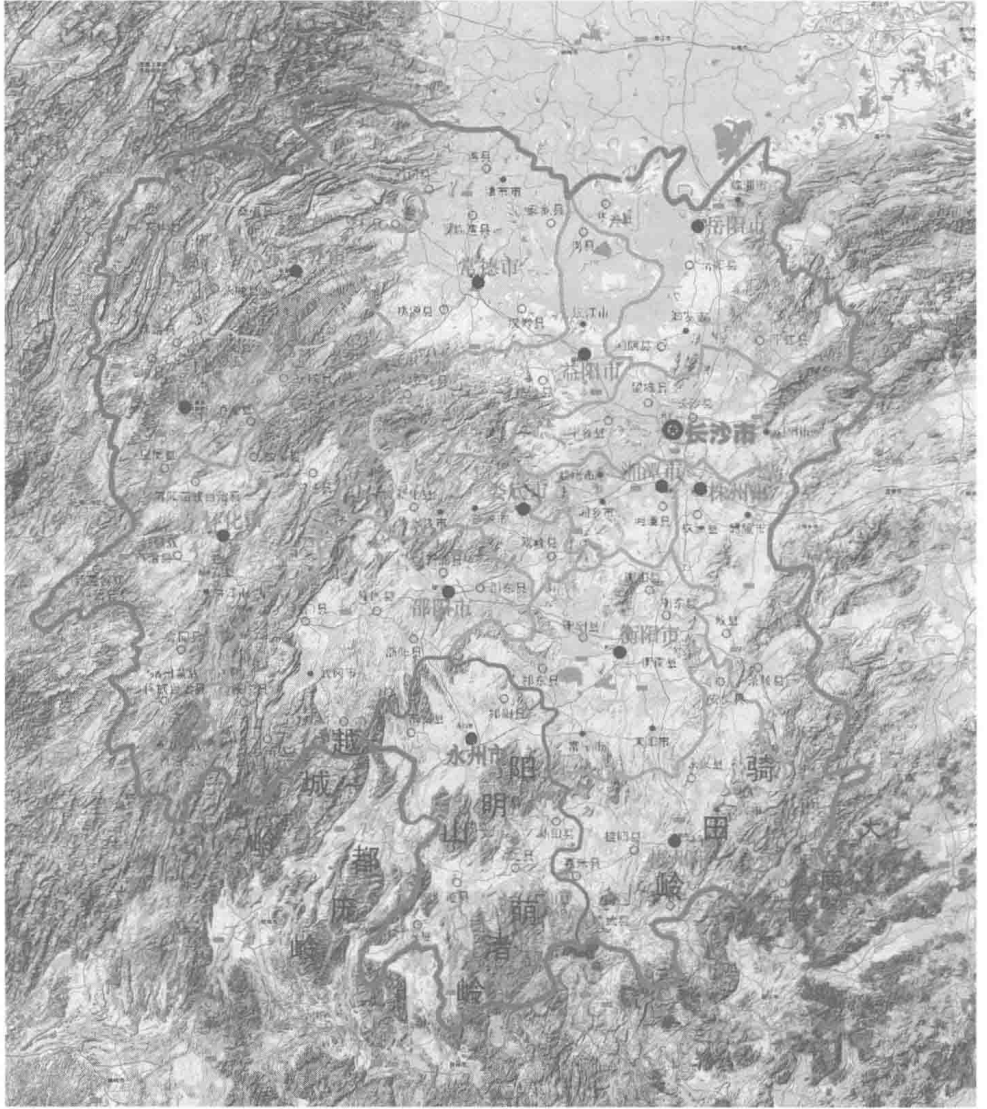
图1-1-1 湖南省地形地貌图

100km 以上的有 50 条, 500km 以上的有 7 条。全省境内河网密度为平均每平方公里河流长度 1.3km。除少数河道出流邻省外, 绝大部分集结于湘水、资水、沅水、澧水, 而后汇注洞庭湖, 构成一个沟通长江具扇形辐聚式的洞庭湖水系 [1] 。