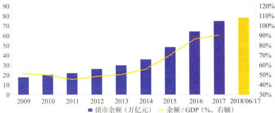
图 1-3 中国债券存量余额（2009 ~ 2018 年）

截至 2017 年年末，我国债券市场总规模已达人民币 74.69 万亿元，位居全球第三，仅次于美国和日本，债券余额及占 GDP 的比例逐年递增（见图 1-3）。