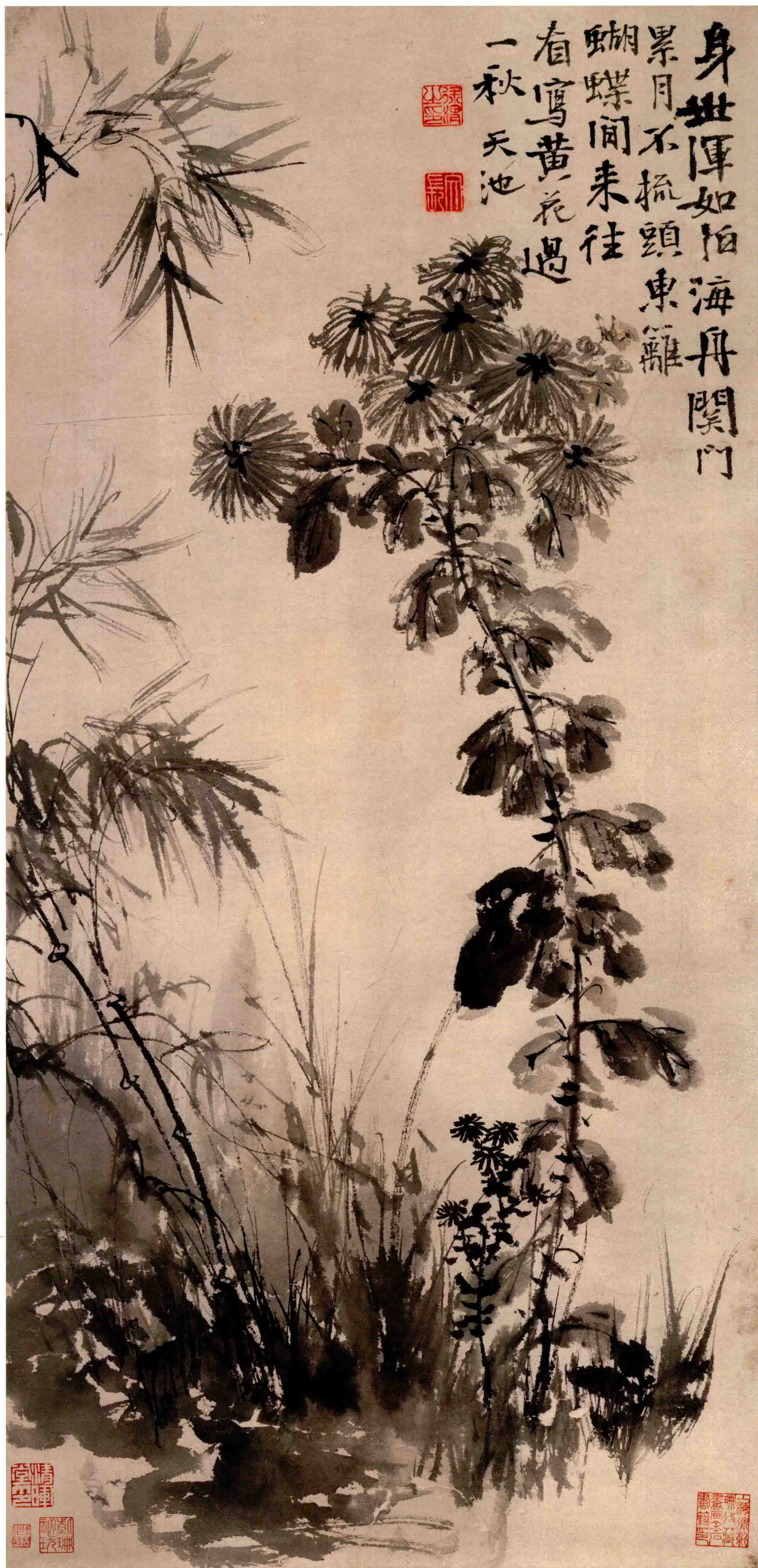
32. 明 徐渭 竹菊圖 紙本 水墨 縱95.0厘米 橫45.9厘米 遼寧省博物館藏

Bamboos and Chrysanthemums Xu Wei, Ming Dynasty Ink on paper, 95.0 cm × 45.9 cm Liaoning Provincial Museum