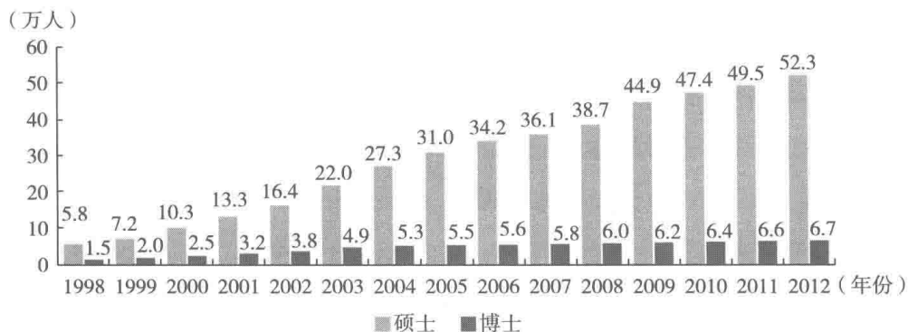
图 1-3 1998~2012 年全国研究生招生数